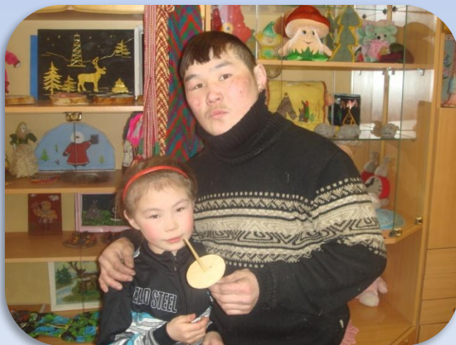
«Парня» - юла