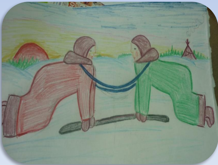
«Мэбета –Самый сильный»