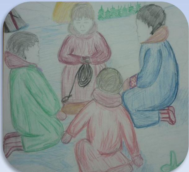
Нартикова»-Охота на нерпу»