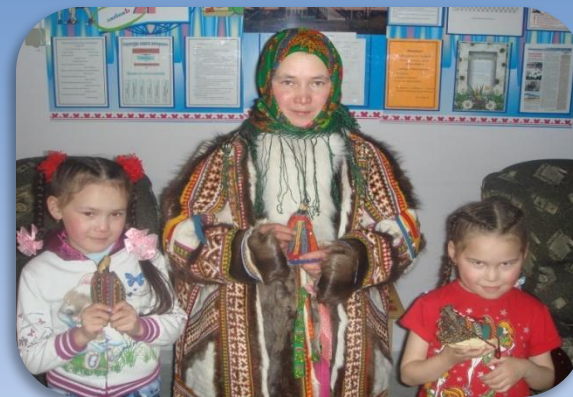
«Мяд тер» - семья