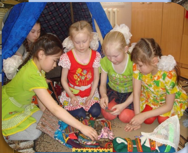
«Мяд тер» - семья