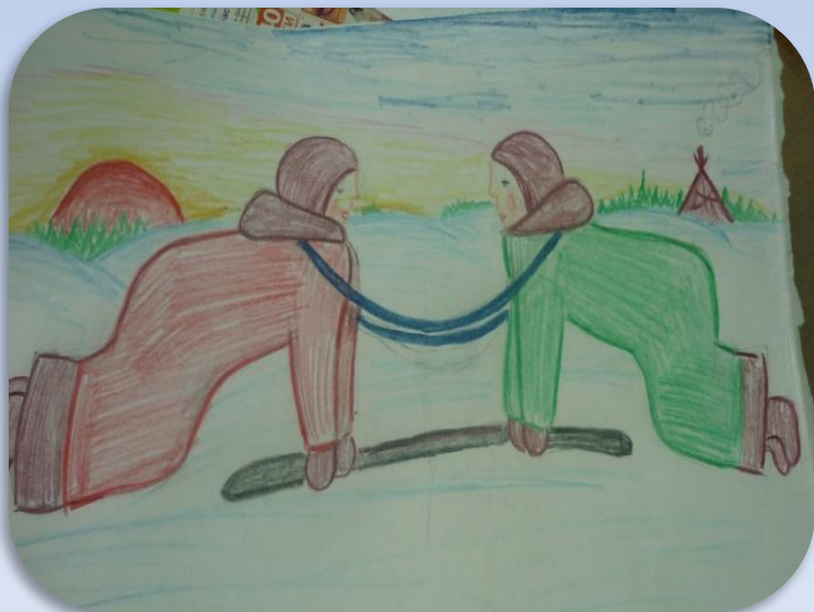
«Мэбета –Самый сильный»