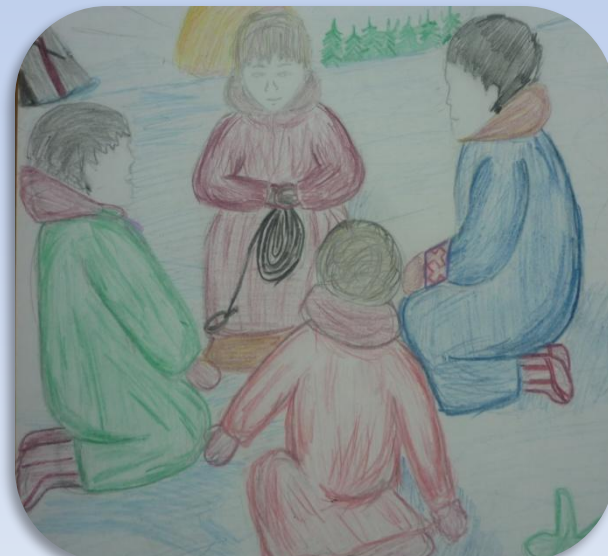
Нартикова»-Охота на нерпу»