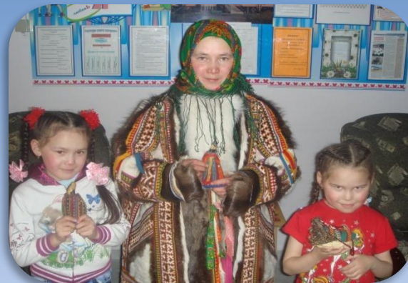
«Мяд тер» - семья