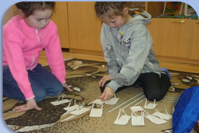
«Ямданава» - каслание