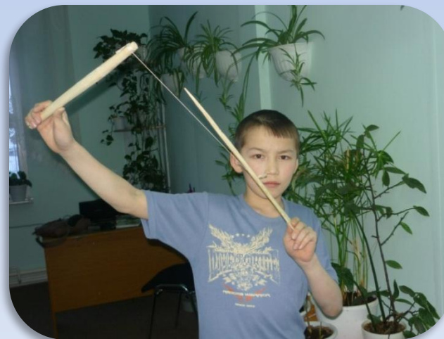
«Вынько» - лук