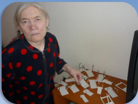
«Ямданава» - каслание