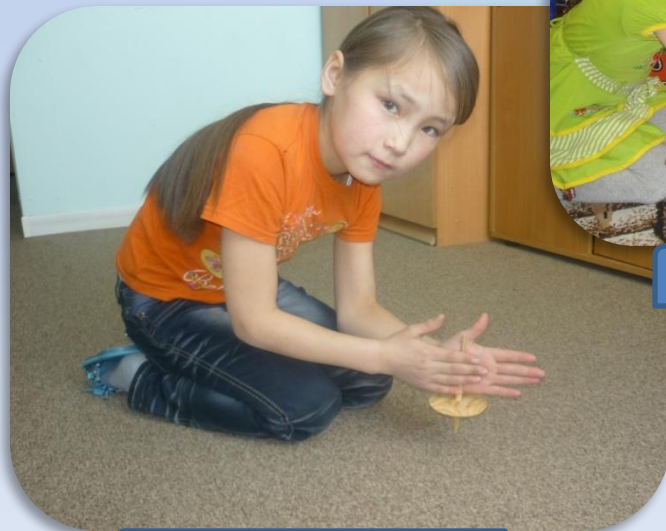
«Парня» - юла