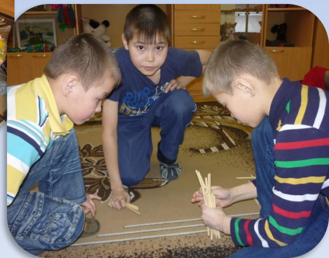
«Тыранийко» - палочки