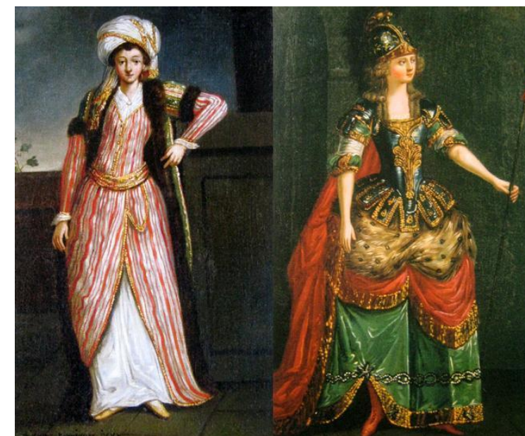
African. Dans Alaoué / Reine de Guleande