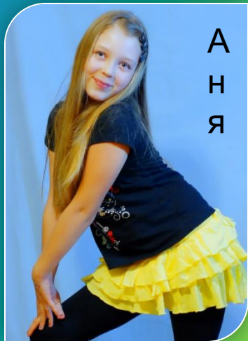
А н я