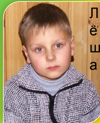
Л ё ш а