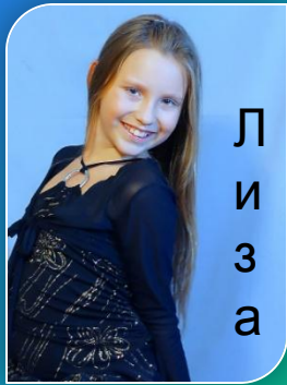
Л и з а