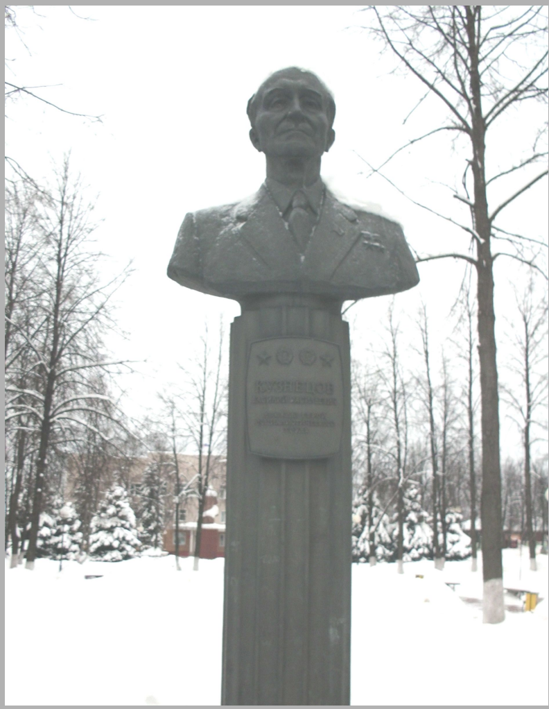
Бронзовый бюст дважды Героя Социалистического Труда В.В. Кузнецова, уроженца Семеновского района. Автор академик Л.Е. Кербель

Памятники советской эпохи играют теперь, прежде всего, мемориальную роль, имеют историко-познавательное значение