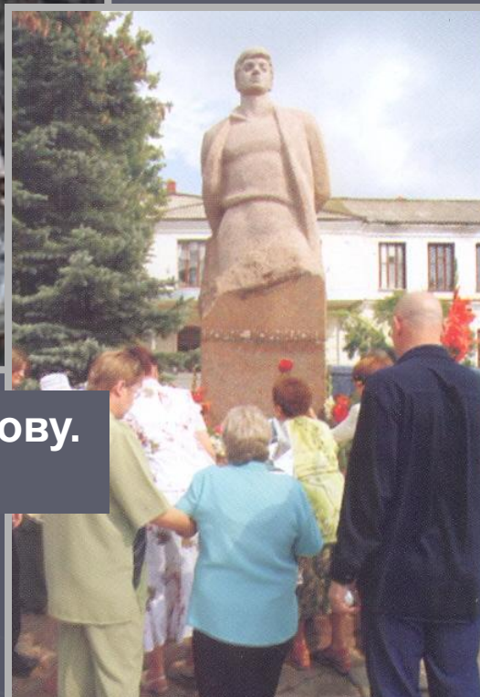
Памятник Борису Корнилову. Автор А.А. Бичуков

Камень был заложен в 1967 году, к 60-летию со дня рождения поэта, возле Дома пионеров. Открыт памятник к юбилею комсомола в 1968 году. На площадь был перенесен и установлен в 1987 году.