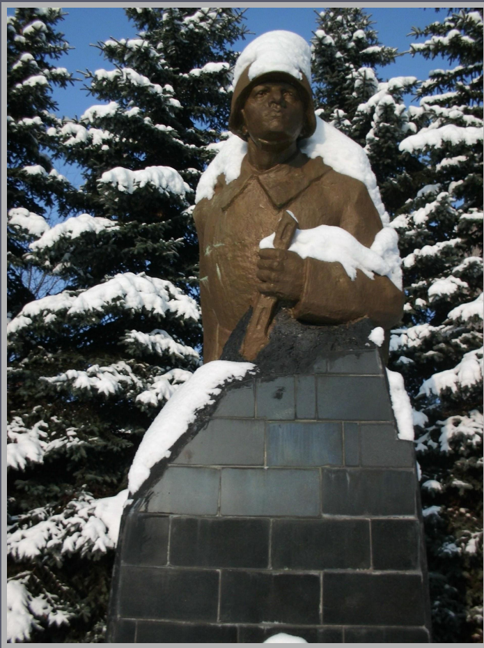
Памятник Воину освободителю на территории Арматурного завода