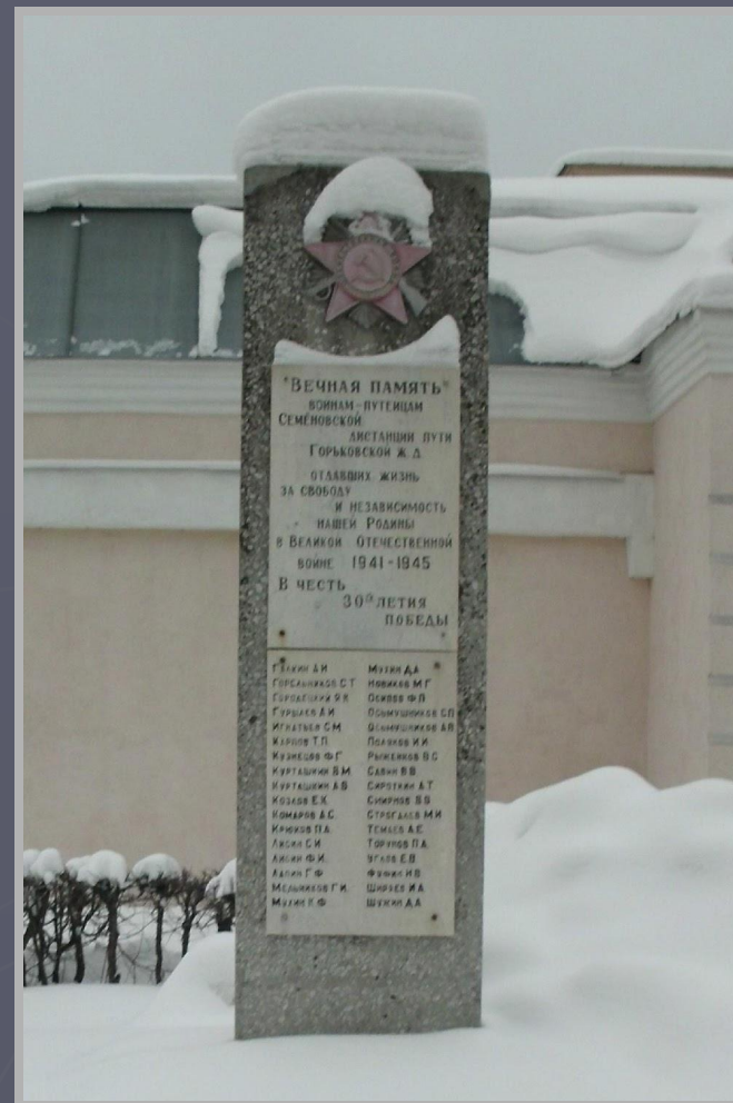
Памятник Воинам-путьцам, отдавшим жизнь за свободу и независимость нашей Родины