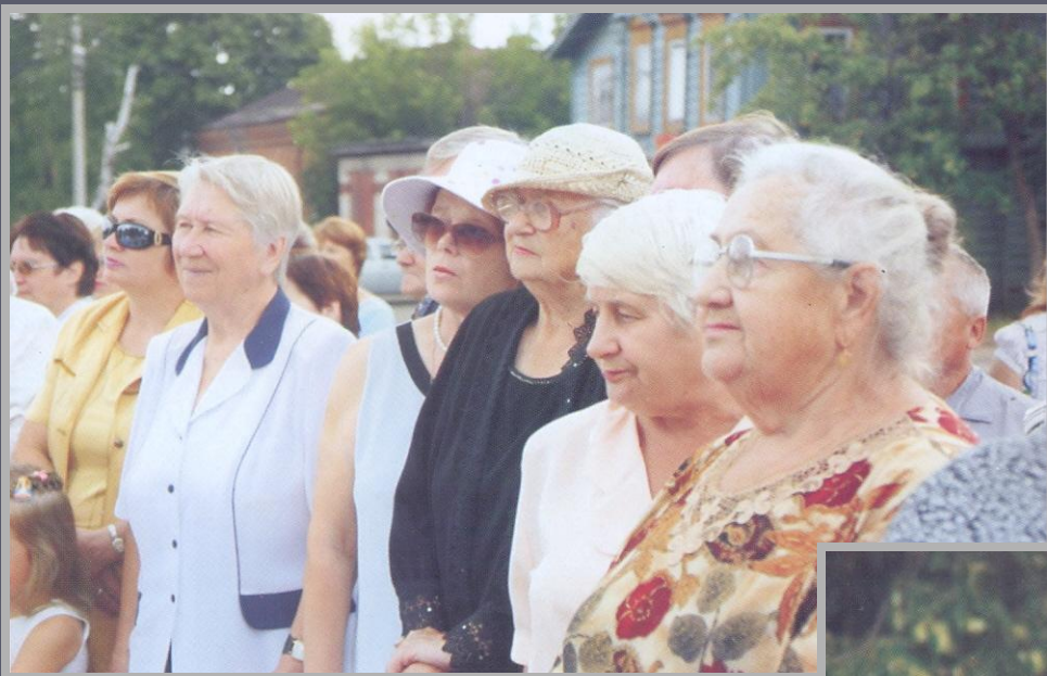
Жители города Семёнова на митинге, посвящённом 100-летию Б.П. Корнилова