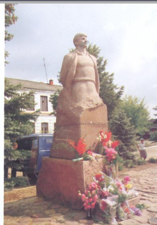
Возложение цветов к памятнику Бориса Корнилова