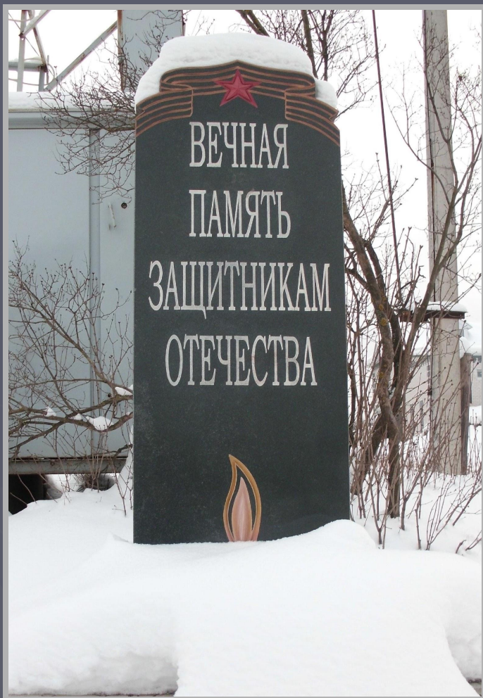
Плита Защитникам Отечества перед деревней Дьяково