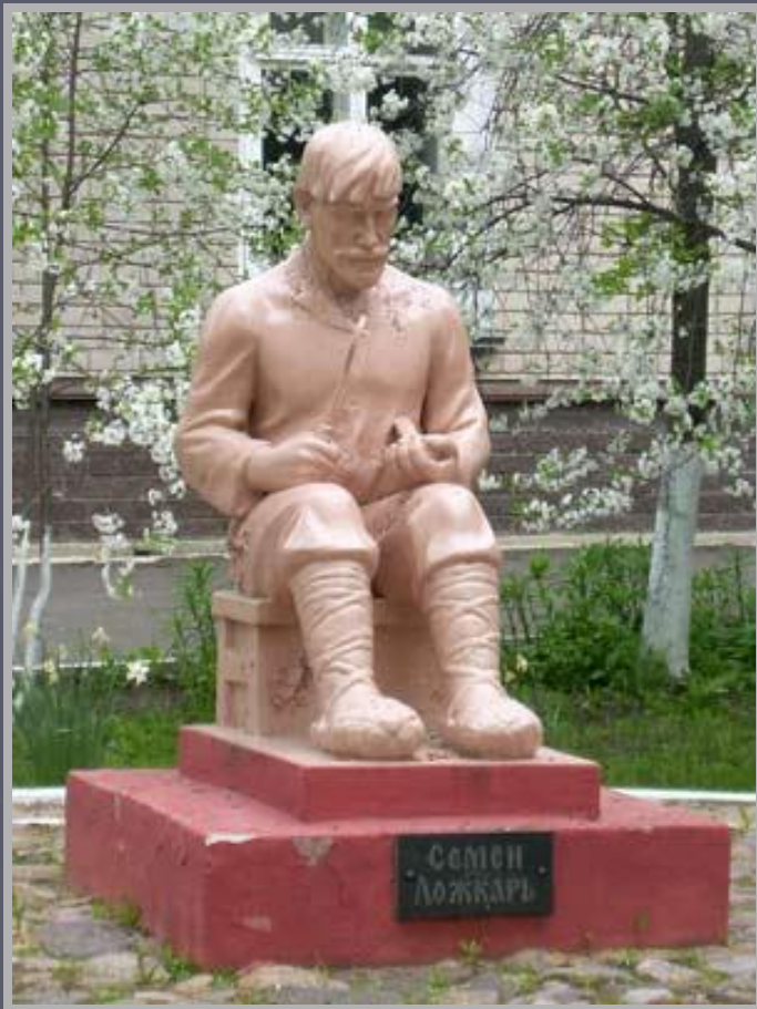
Памятник Семёну Ложкарю. Автор Е. Коржова

Семён Ложкарь – это собираТЕЛЬНЫЙ образ крестьянина-ремесленника, человека труда. И вместе с тем наша дань всему люду трудовому, ремесленникам нашего края.