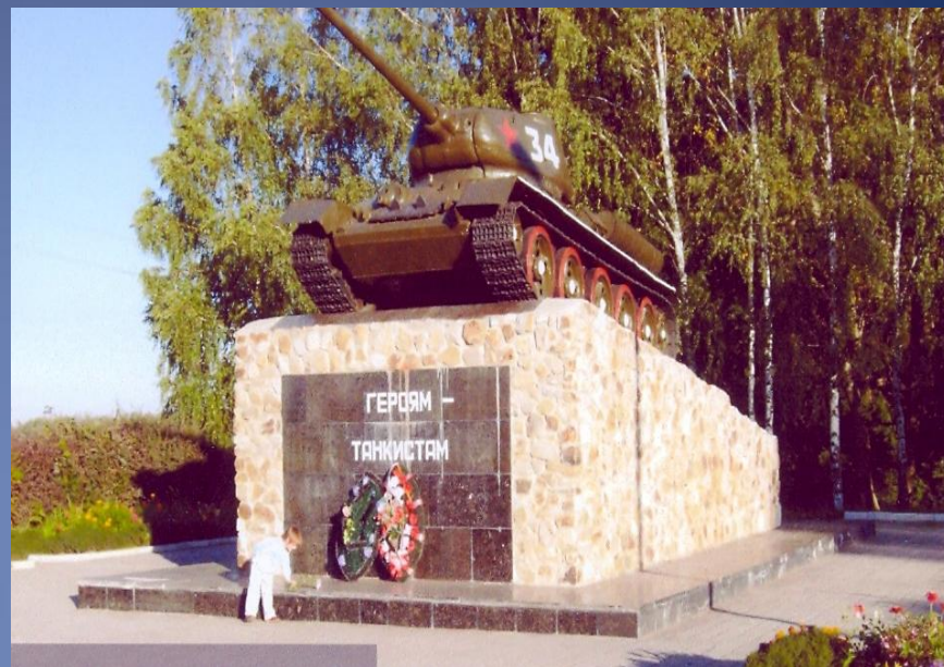
ПАМЯТНЫЙ ЗНАК ТАНКИСТАМ 2-Й ТАНКОВОЙ АРМИИ У ВЪЕЗДА В РАЙЦЕНТР ПОНЫРИ.