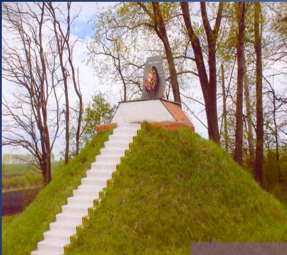
ПАМЯТНЫЙ ЗНАК ГЕРОЯМ - СВЯЗИСТАМ