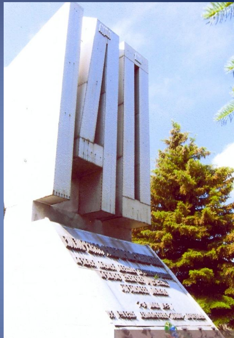
ПАМЯТНЫЙ ЗНАК В ЧЕСТЬ 140-й СТРЕЛКОВОЙ ДЕВИЗИИ