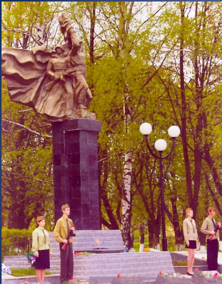
МЕМОРИАЛЬНЫЙ КОМПЛЕКС ГЕРОЯМ СЕВЕРНОГО ФАСА КУРСКОЙ ДУГИ