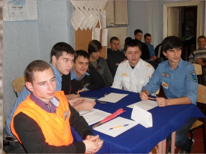
Рольова гра “Кредитування підприємств”у