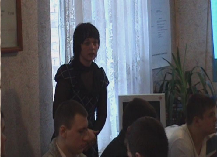
Інтегроване відкрите заняття – семінар “Організація та облік заробітної плати на залізничному транспорті”