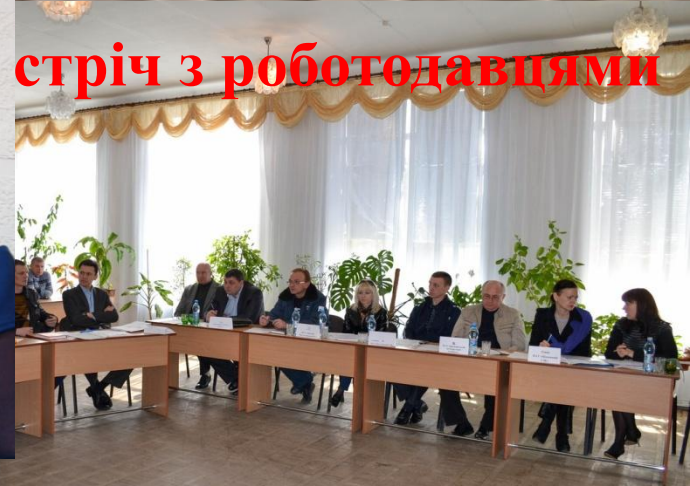
стріч з роботодавцями