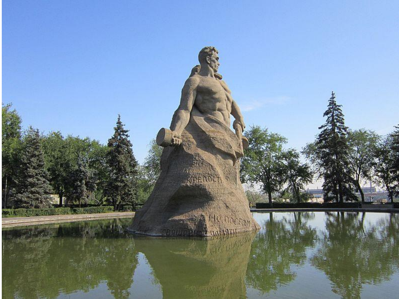
Скульптура «Стоять насмерть»