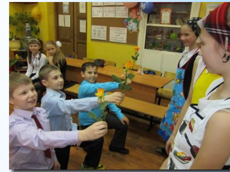
Праздник «С 8 марта!»