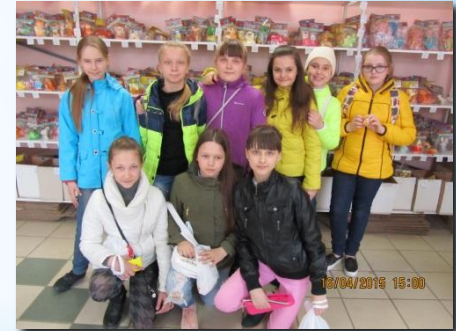
Экскурсия на фабрику игрушки