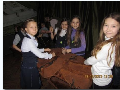
Урок в Краеведческом музее «Первые поселения на Воронежской земле»