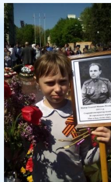
Акция «Бессмертный полк»