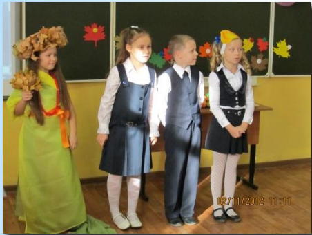
Проект «Золотая осень»