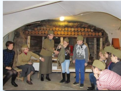
Урок в Краеведческом музее «Город - боец»