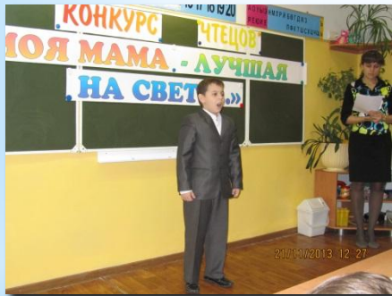
Проект «Моя мама – лучшая на свете...». Конкурс чтецов