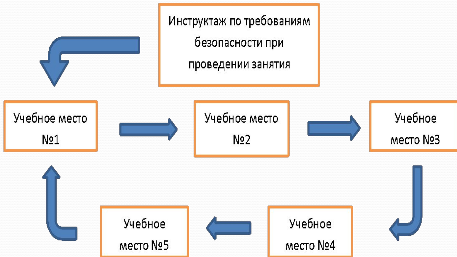
Схема замены на учебных местах.