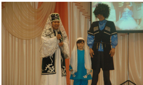
Таланты «Я и моя семья» «Таланты моей семьи»