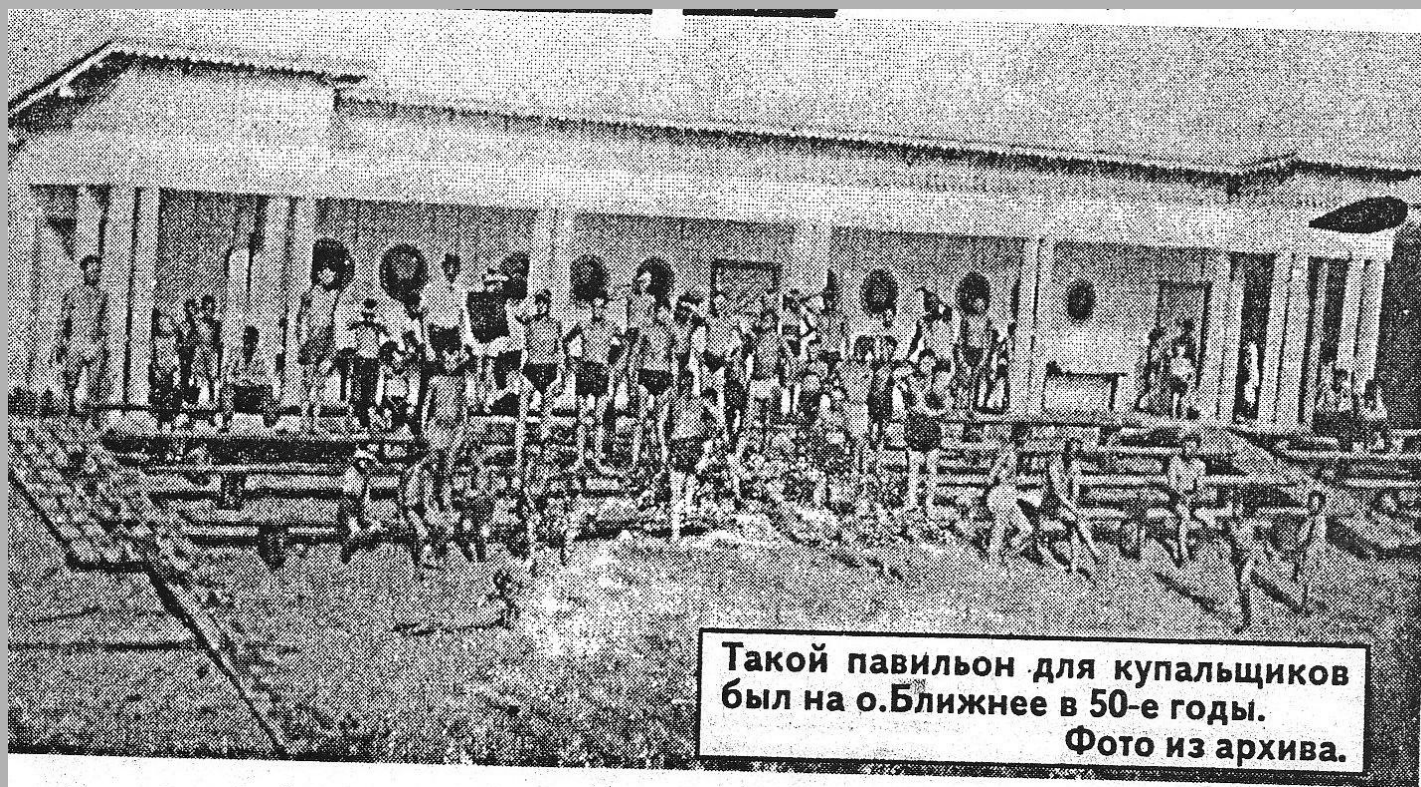
Такой павильон для купальщиков был на о.Ближнее в 50-е годы.