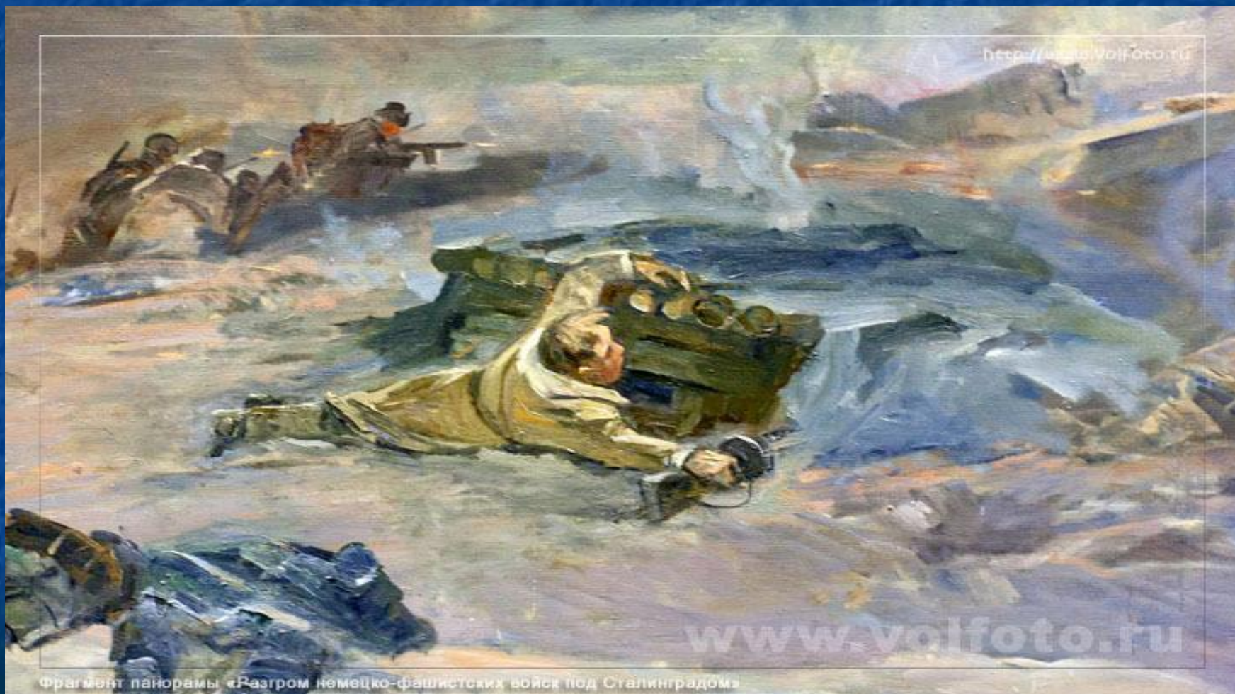
фрагмент панорамы «Разгром немецко-фашистских войск под Сталинградом»