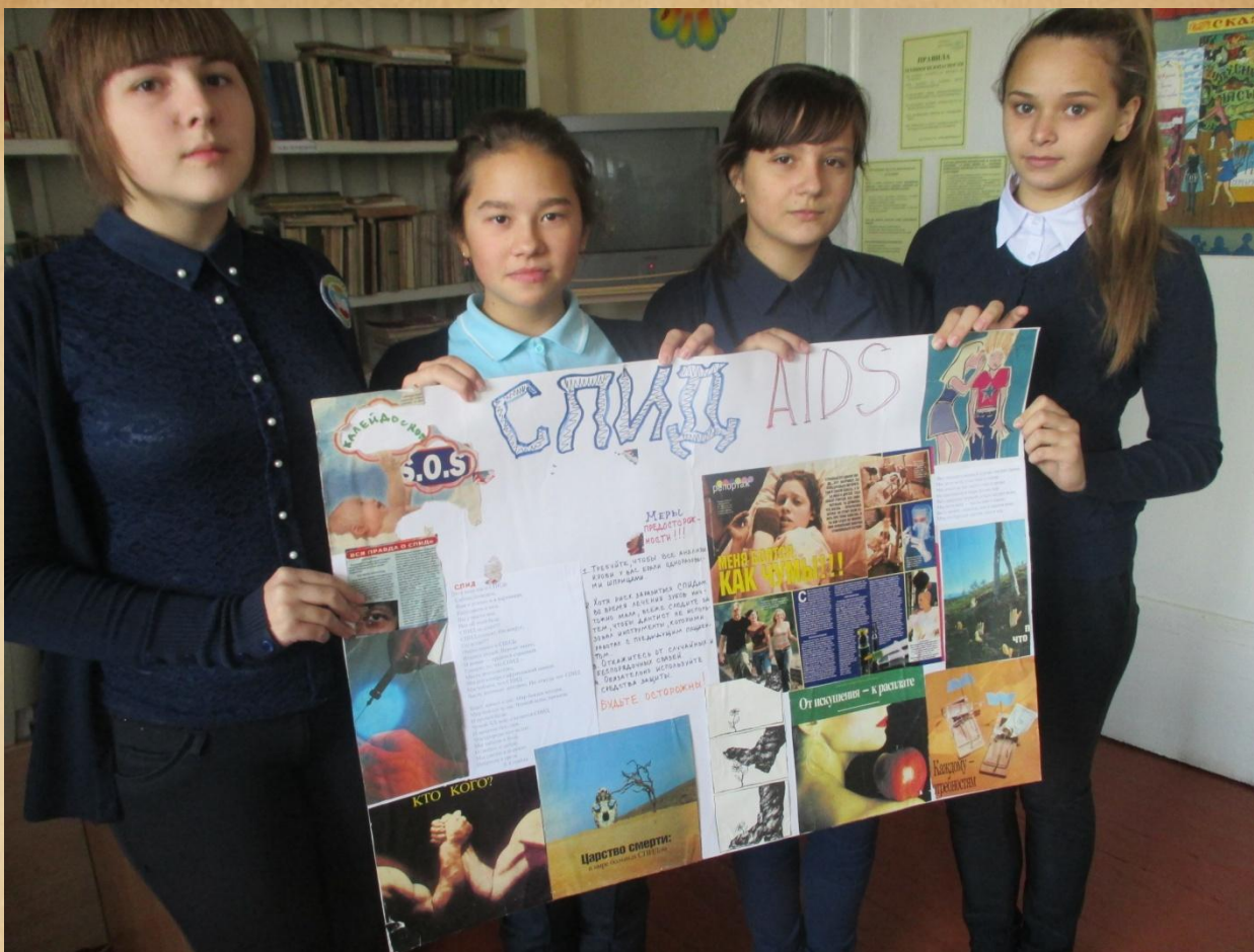
Пропаганда ЗОЖ . Выпуск школьной газеты « Я –выбираю жизнь .»