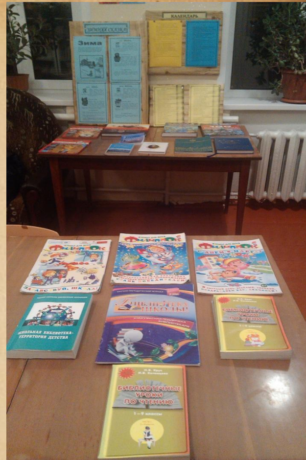
Реклама печатной продукции