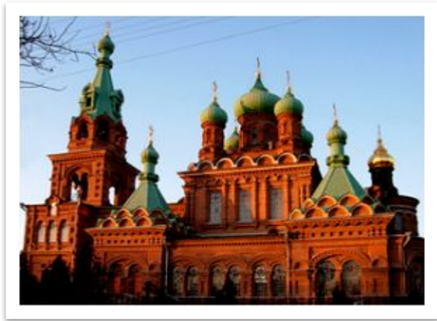
Свято-Троицкий храм. (1899-1910 )