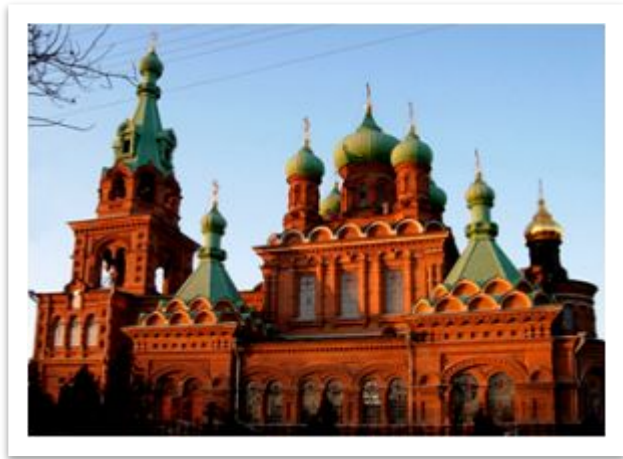
Свято-Троицкий храм. (1899-1910 )