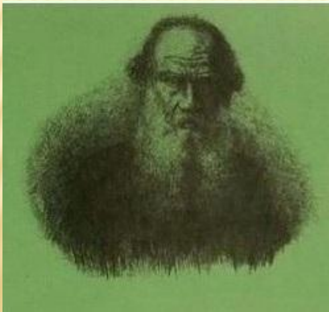
Л. Н. Толстой