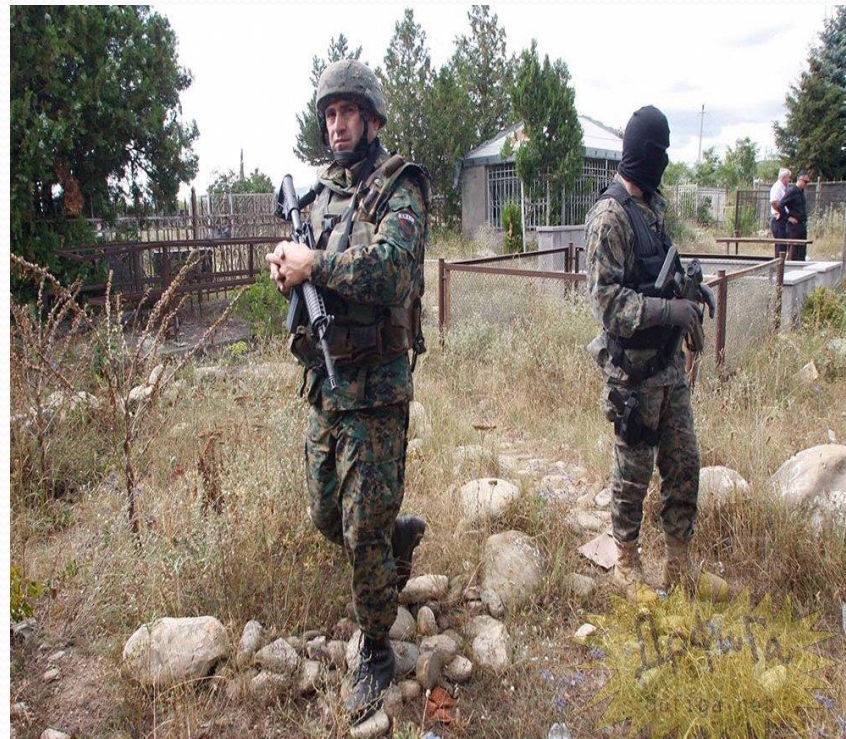
Грузинский спецназ в одном из сел рядом с Цхинвали. Грузинских военных в подписях к фотографиям именуют миротворцами