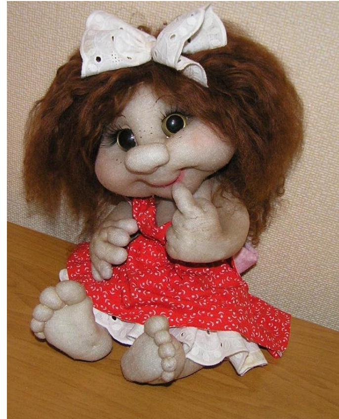
Кукла из капроновых колготок