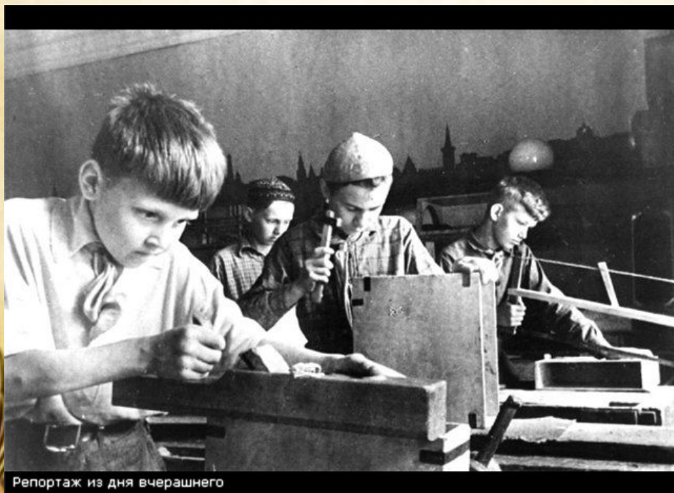
Репортаж из дня вчерашнего

Смертельная угроза нависла над нашей Родиной. Все, кто мог воевать, пошли на фронт. Остальные помогали армии в тылу, обеспечивая её продовольствием, снаряжением и боеприпасами.