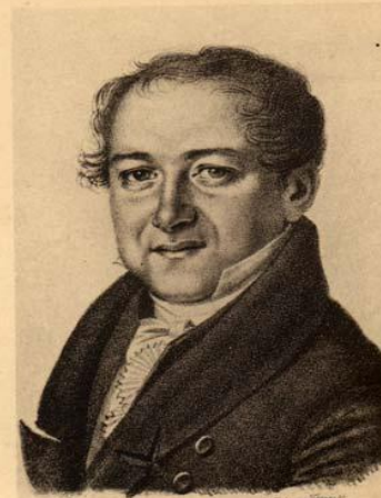
Рис. В. Баранов. Михаилъ Семен. ЩЕПКИНЪ. (1788—1863) 10.