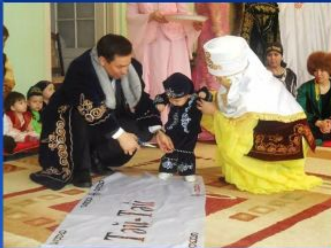
Тұсау кесу (Тусау кесу)