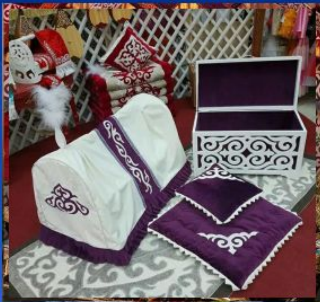
Қыз жасауы (қыз жасауы)