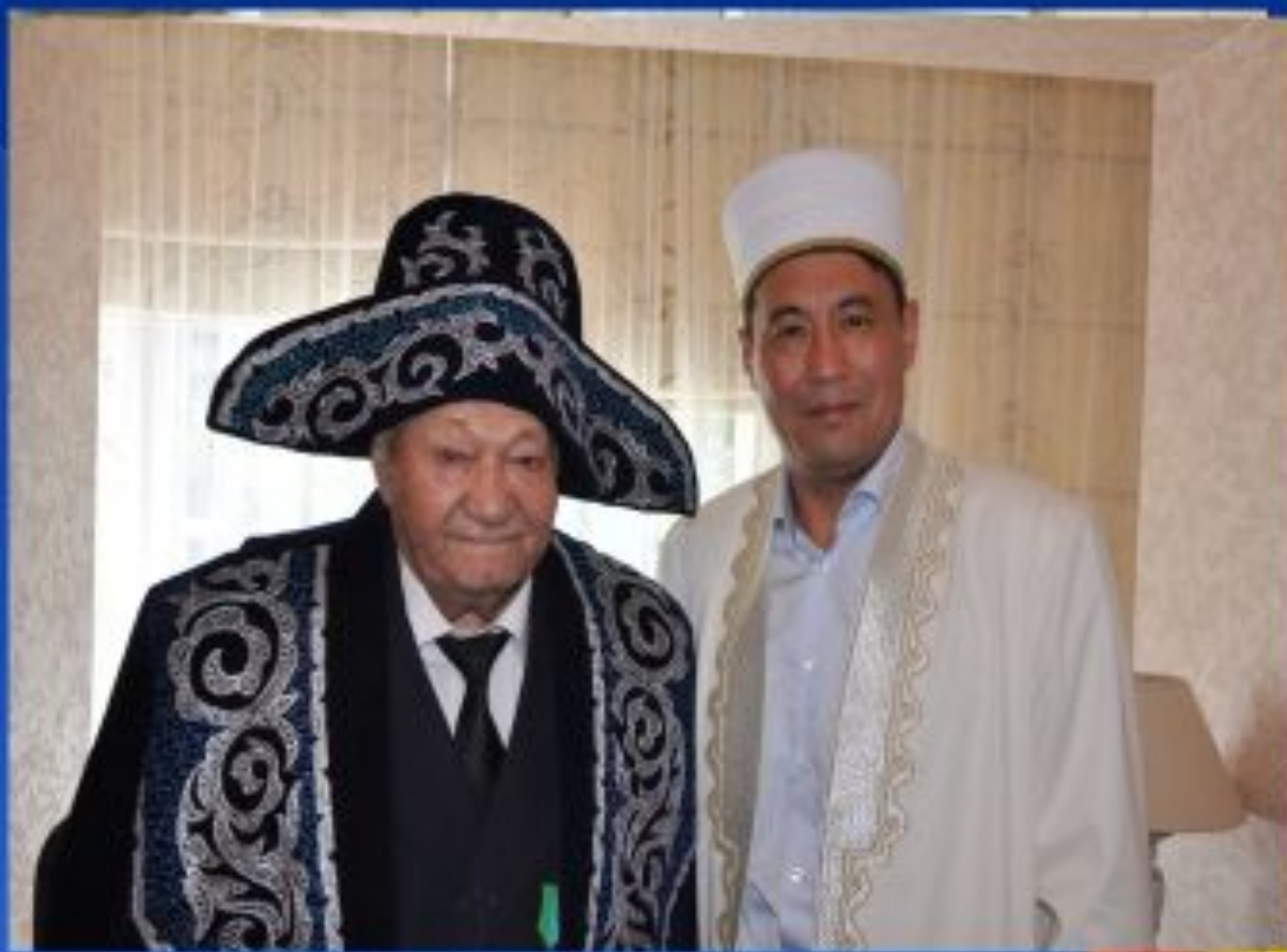
Ат мінгізіп, шапан жабу (Ат мингизип шапан жабу)