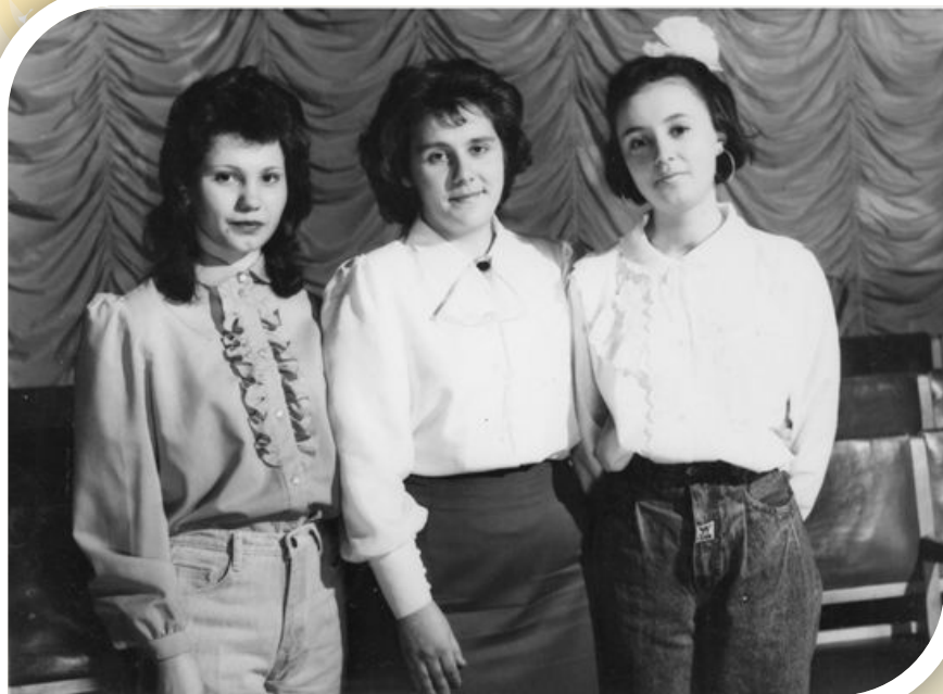
Мой первый выпуск 1991 год

1989–1996 гг. мастер производственного обучения ПТУ №27 г. Новосибирска