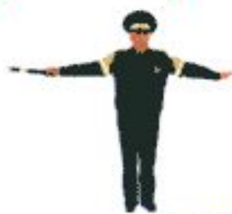
а) вид спереди