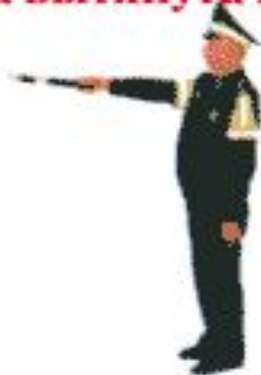
б) вид сбоку - правая рука указывает налево