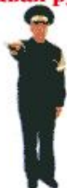
а) вид спереди