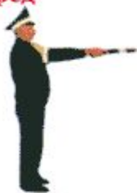
в) вид сбоку - правая рука указывает направо