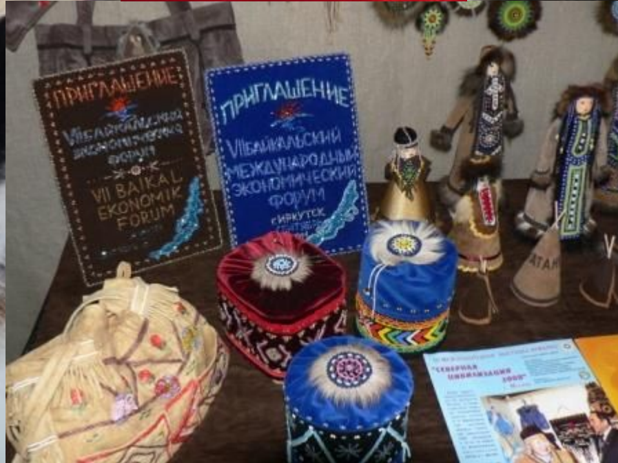
Пом.: «Соболь» Техн., мех, бисер Ганара З.А.