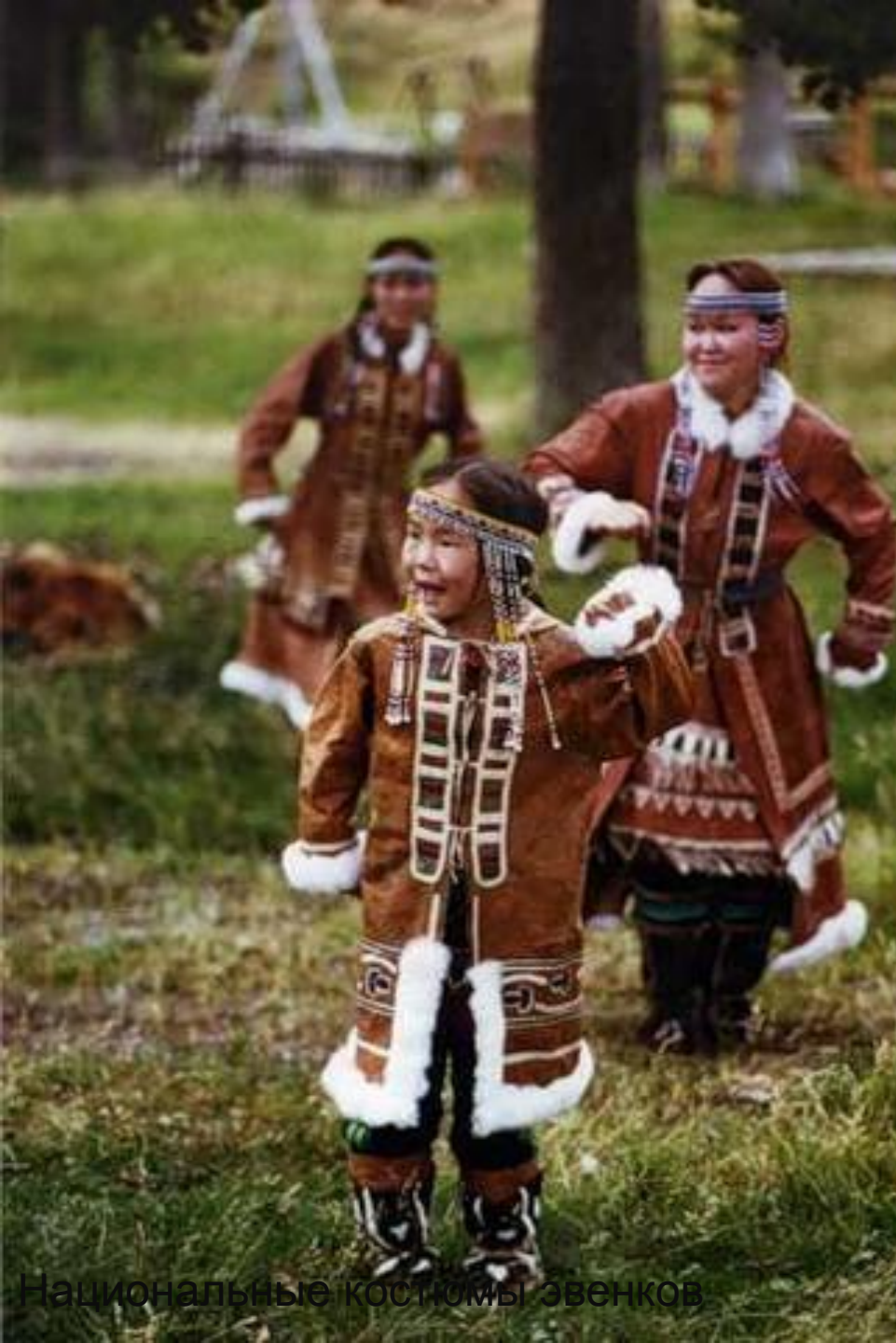
Национальные костюмы эвенков

ВТОРАЯ ТЕОРИЯ ПРЕДПОЛАГАЕТ, ЧТО ЭВЕНКИ ПОЯВИЛИСЬ В РЕЗУЛЬТАТЕ АССИМИЛЯЦИИ МЕСТНЫМ ("ПРОТОЮКАГИРСКИМ") НАСЕЛЕНИЕМ ПЛЕМЕНИ УВАНЕЙ, ГОРНО-СТЕПНЫХ СКОТОВОДОВ ВОСТОЧНЫХ ОТРОГОВ БОЛЬШОГО ХИНГАНА.