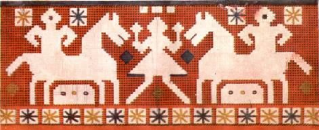
В эвенкийском орнаменте в яркой форме раскрываются художественные особенности эвенков, их эстетические вкусы, чувство ритма.