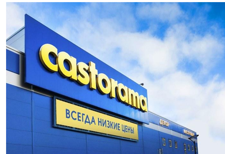
Основной конкурент на французском рынке