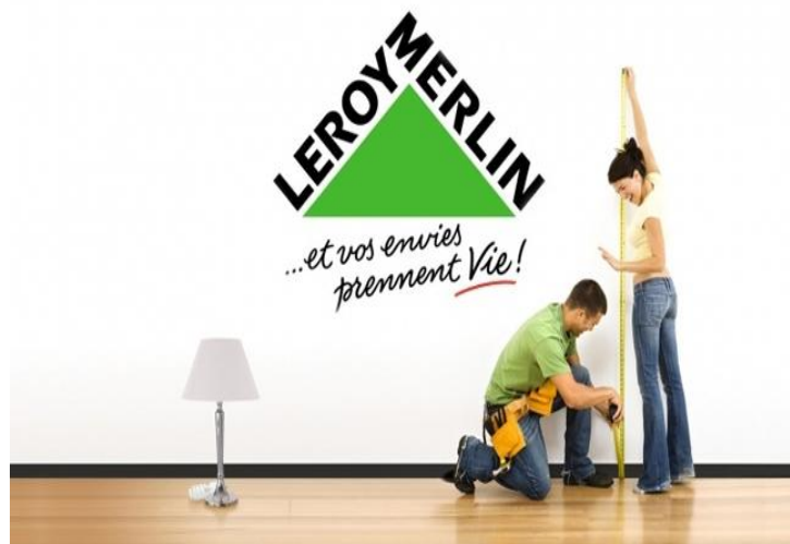
1960 год – Au Stok American переименован в Leroy Merlin