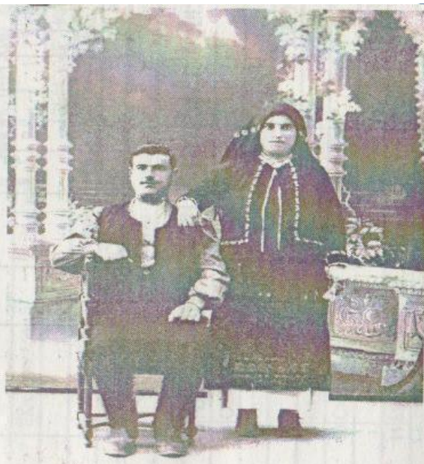
Семья Поповых из с. Кабурчак

Указом президиума Верховного совета РСФСР от 21 августа 1945 г. Къабурчакъ был переименован в Мичуринское т.к. большинство переселенцев переехало из Мичуринского района Белгородской области.