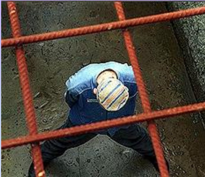
Чистая совесть (2 жетона)