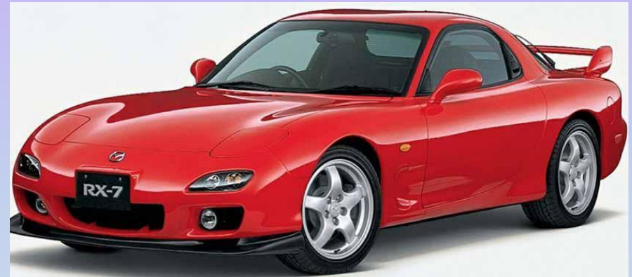
Новый спортивный автомобиль (1 жетон)