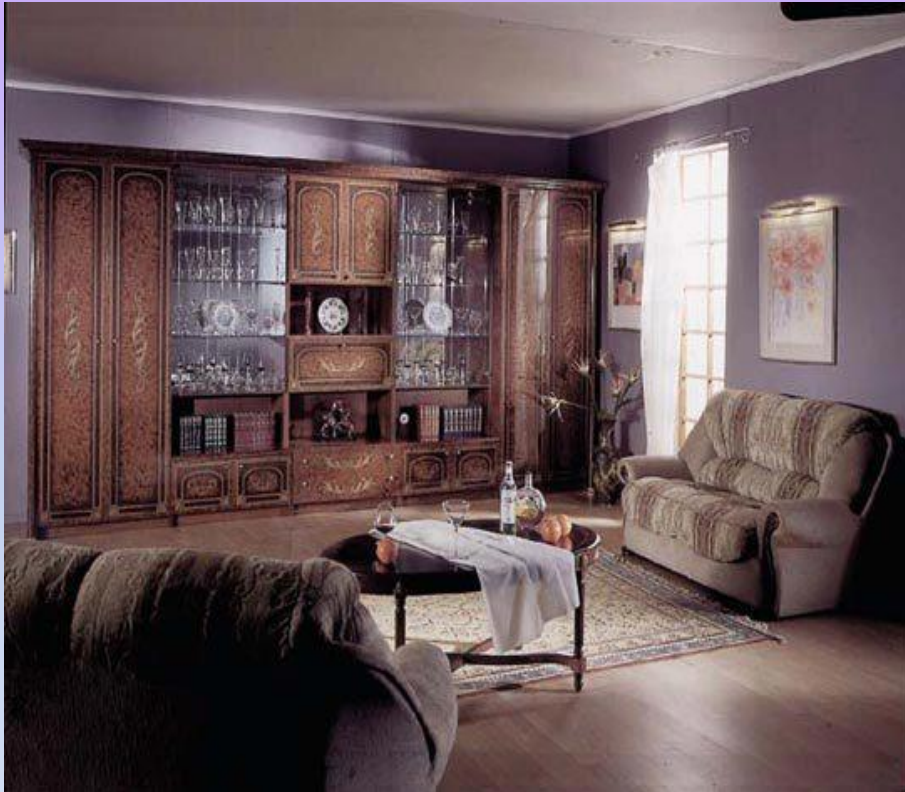
Хорошая просторная квартира или дом (1 жетон)