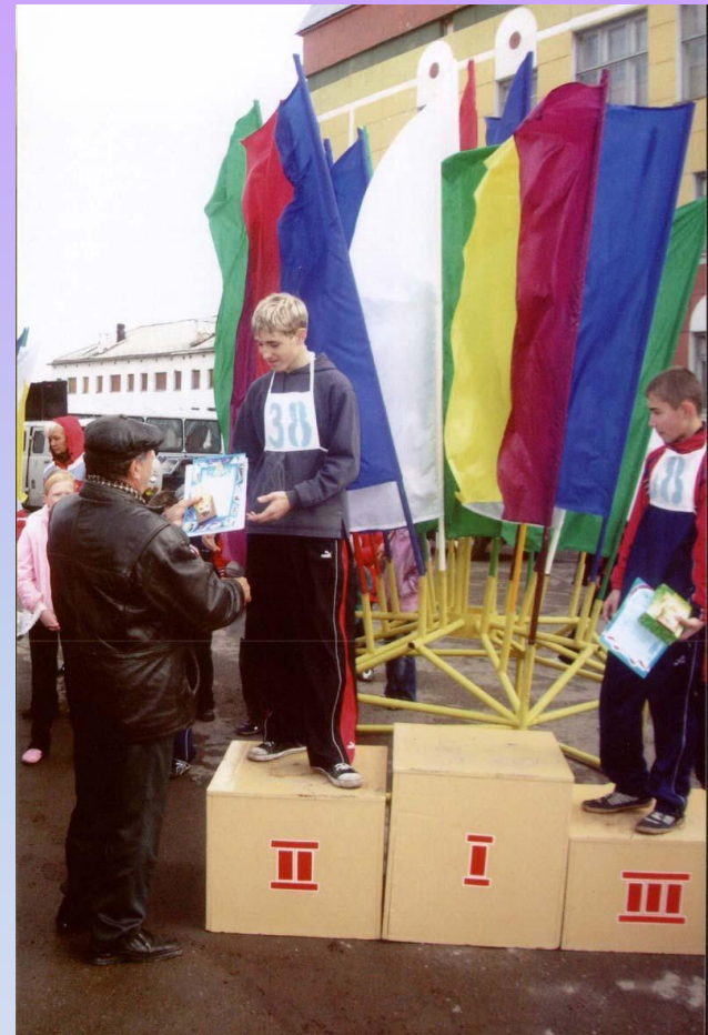
Умение добиваться успеха во всем, чего бы вы ни пожелали (2 жетона)