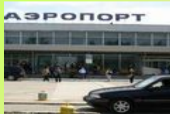
Аэропорт Большое Савино