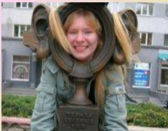
Памятник Пермяк соленые уши