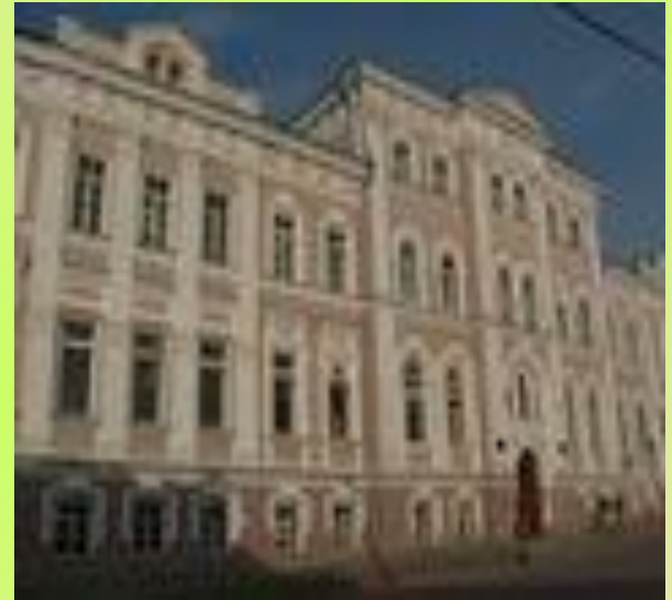
Пермский государственный институт искусства и культуры