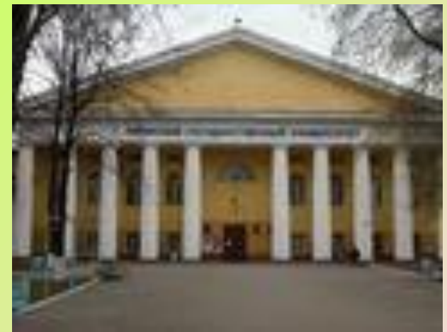
Пермский государственный университет