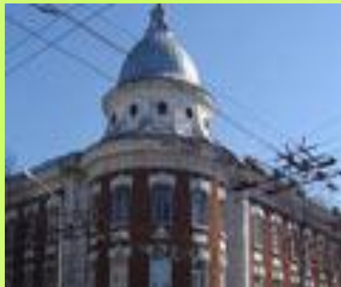
Пермский государственный педагогический университет

В тройку крупнейших вузов города входит и пермский государственный педагогический университет. История его существования стартовала со 2 сентября 1919 года, когда в Перми был создан институт народного образования, который в 1921 году был преобразован в педагогический институт. Он является одним из лучших педагогических вузов России. Обучение в ПГПУ ведется по 26 специальностям, большая часть которых учителя различных направлений.