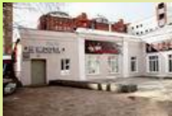
Театр «У моста»

Театр «У моста» – это первый в мире мистический театр. Основатель и художественный руководитель театра известный в России и мире режиссёр – Сергей Федотов. Здесь ставятся спектакли по произведениям Н.Гоголя, М.Булгакова, У. Шекспира, Б. Стокера.