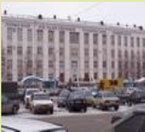
Пермский Государственный технический университет

Пермь – это не только промышленный, но и культурный, и образовательный центр региона. Огромное количество высших и среднеспециальных учебных заведений ежегодно выпускают сотни специалистов высокого класса. Старейшим вузом города и Урала является Пермский государственный университет, который был основан в 1916 году. В 2006 году, в ходе всероссийского конкурса, ПГУ вошел в число восьми лучших вузов России.