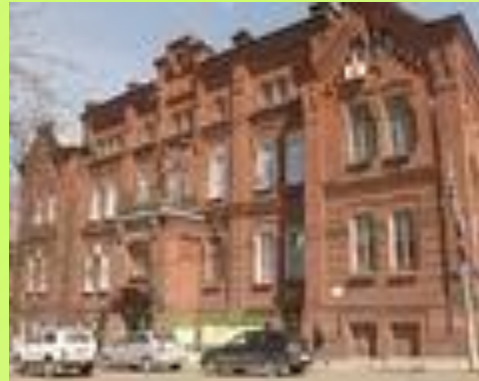
Пермская государственная сельскохозяйственная академия