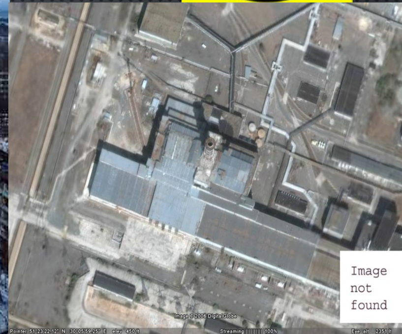
Image not found