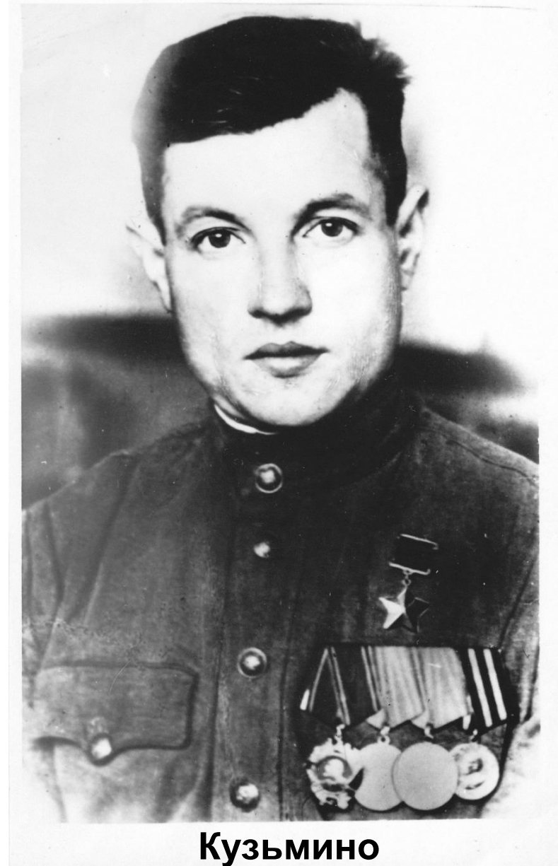
Кузьмино в Василий Иванови

Умер 20 ноября 1982 г., похоронен на Калитниковском кладбище г. Москвы.