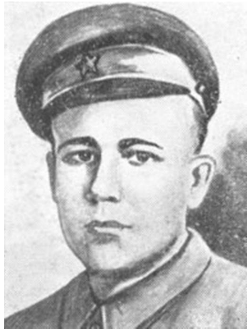
Мяснико в Александр р Сергей