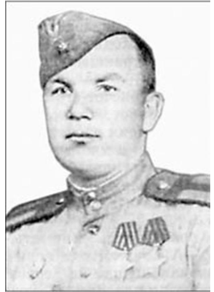
Голосеев Алексей Александрович

На мемориальном комплексе поселка Белоомут установлен памятник Герою.