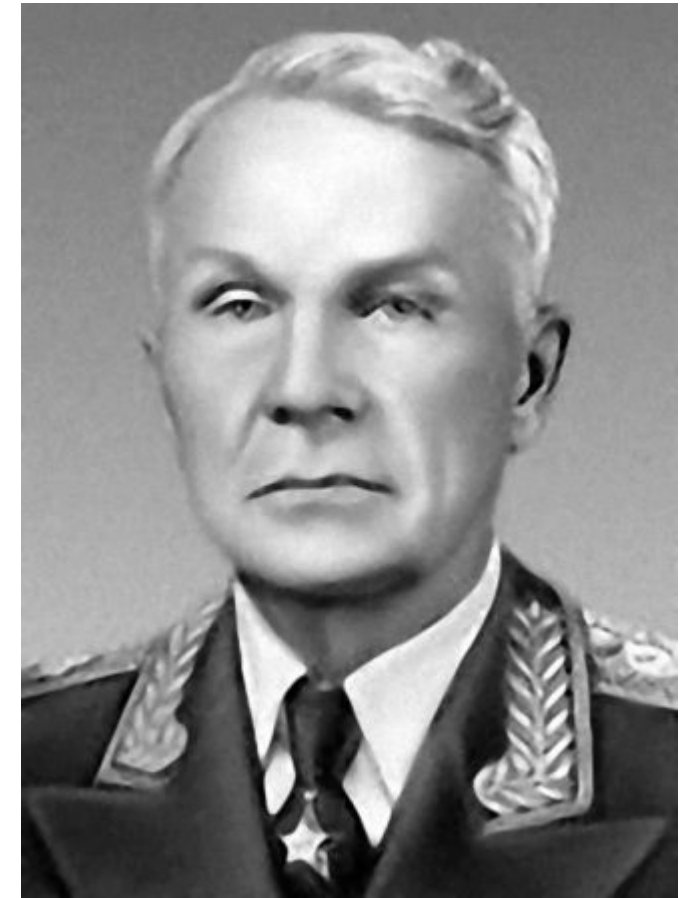
Алексей Иванович Прошляков

Именем Алексея Ивановича Прошлякова названы Тюменское высшее военно-инженерное командное училище и рязанская многопрофильная общеобразовательная школа № 17.