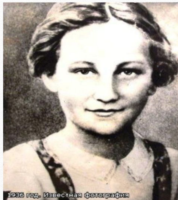
1936 год. Известная фотография

Герой Советского Союза. Боец диверсионно-разведывательного отряда, действовавшего в Московской области, целью которого было уничтожение населенных пунктов, захваченных немцами. Во время одной из операций она была схвачена. Космодемьянскую повесили после длительных и жестоких пыток. Перед казнью произнесла ставшую легендарной фразу: «Сколько нас ни вешайте, всех не перевешаете».