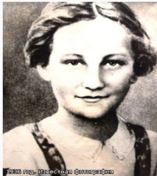
1936 год. Известная фотография

Герой Советского Союза. Боец диверсионно-разведывательного отряда, действовавшего в Московской области, целью которого было уничтожение населенных пунктов, захваченных немцами. Во время одной из операций она была схвачена. Космодемьянскую повесили после длительных и жестоких пыток. Перед казнью произнесла ставшую легендарной фразу: «Сколько нас ни вешайте, всех не перевешаете».