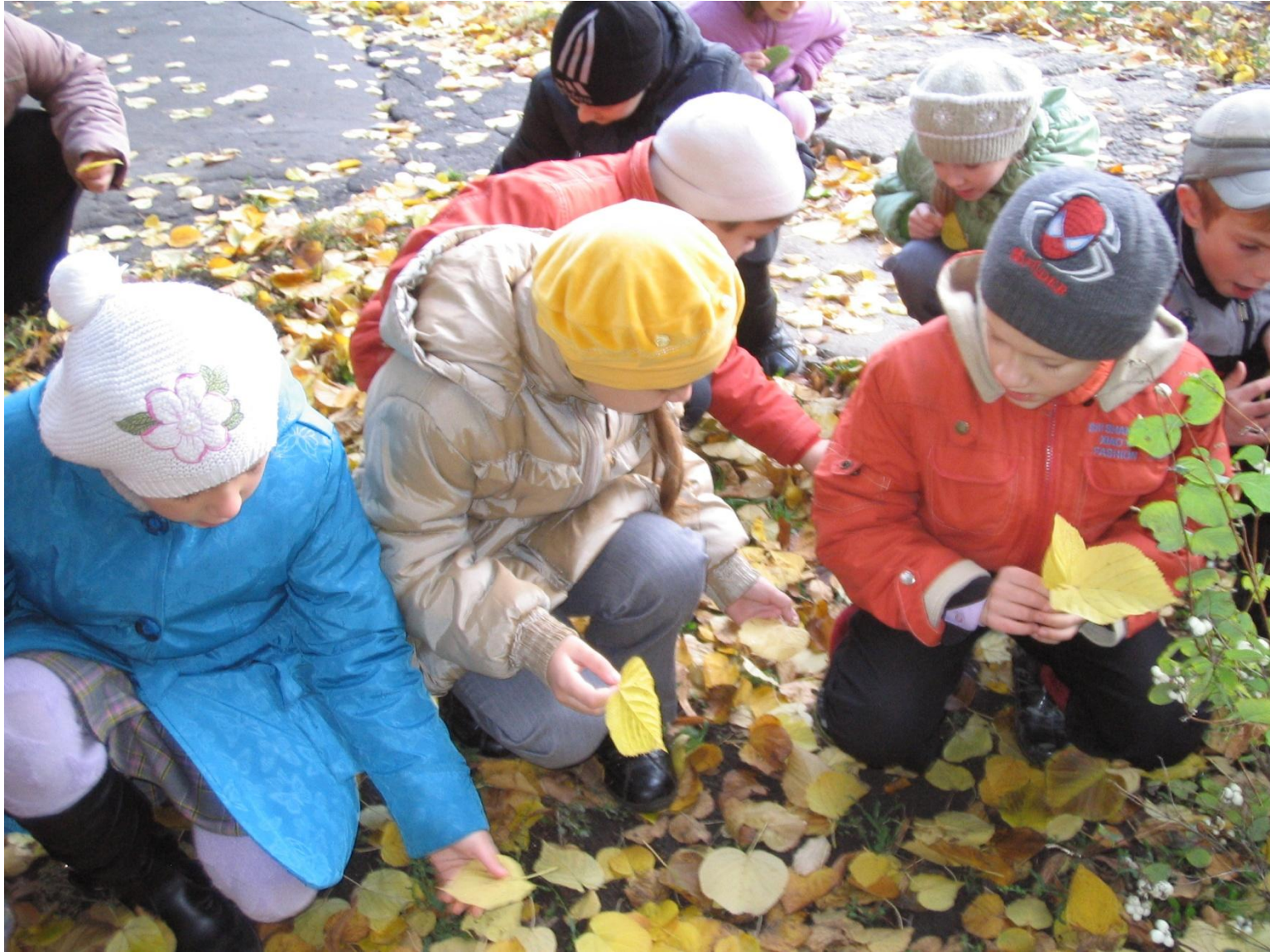
Урок окружающего мира. Исследование листьев