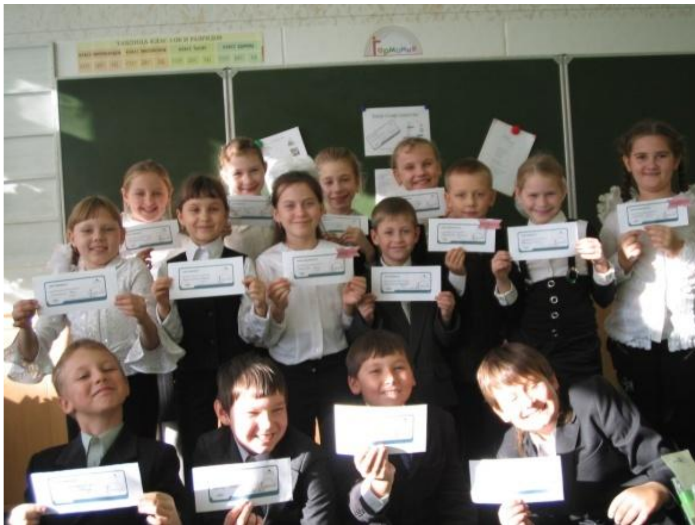
Конкурс «Словарь сложных слов»