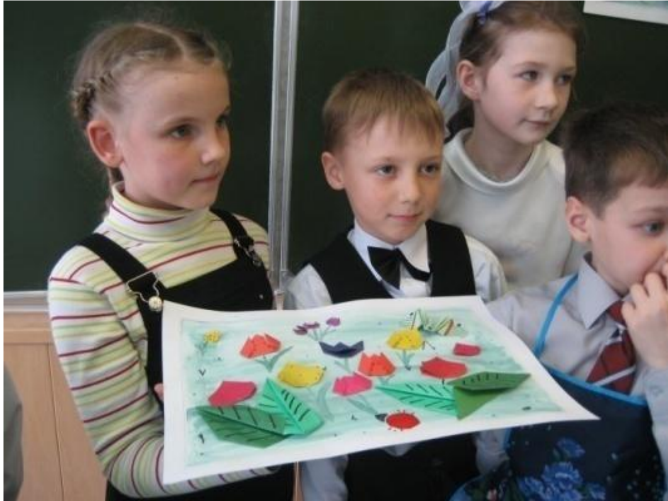
Урок технологии «Простые складки»