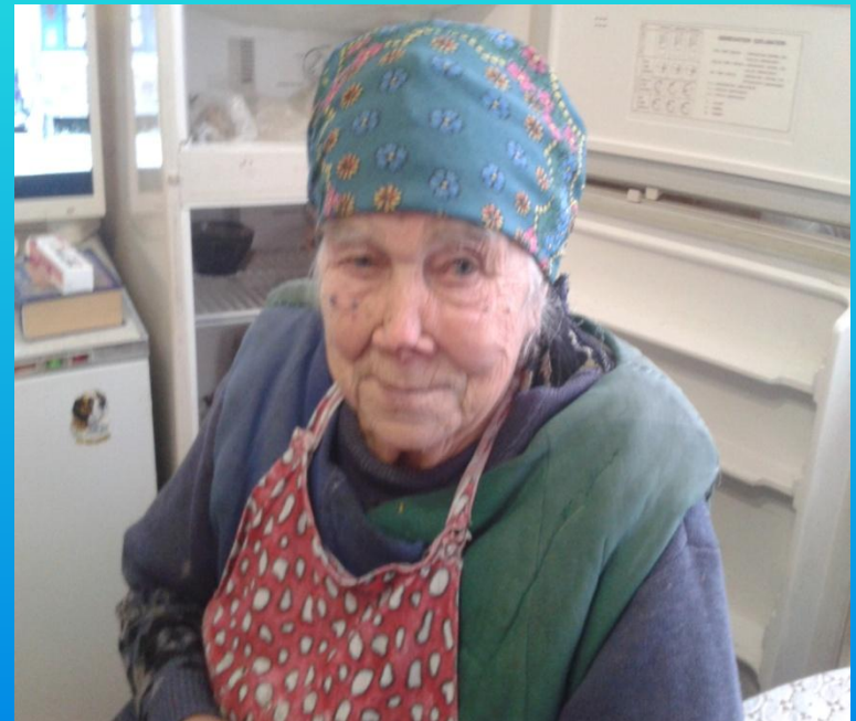
Фото и интервью взяли Киреева А. и Ивашутина А. в октябре 2014г.

Когда кончалась война я уже была в 6 классе. После войны тоже работала в колхозе.