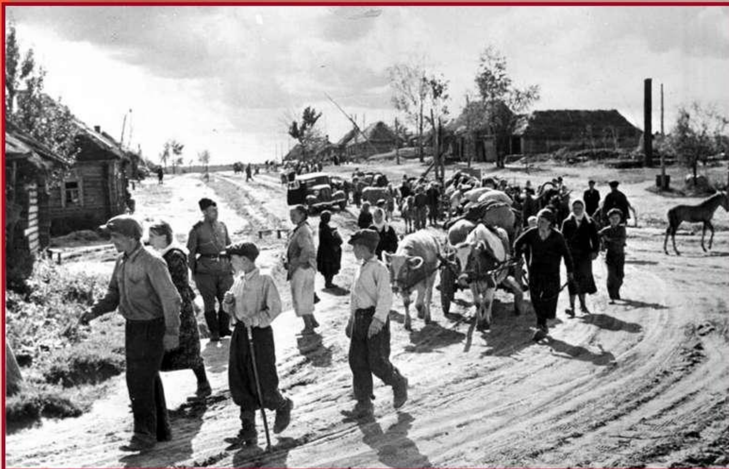
Беженцы на дорогах Смоленщины во время отступления фашистов