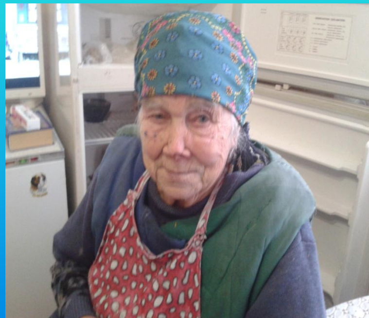
Фото и интервью взяли Киреева А. и Ивашутина А. в октябре 2014г.

Когда кончалась война я уже была в 6 классе. После войны тоже работала в колхозе.