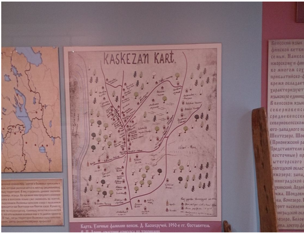
Карта. Уличные фамилии вепсов. Д. Каскеруден. 1950-е гг. Составитель: В. И. Ашурин, заглавие — по традиции