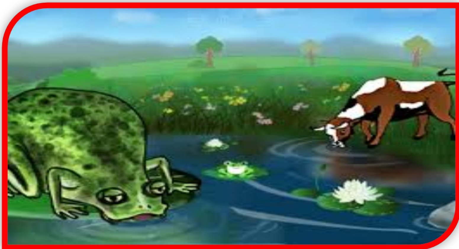
Өгіз бен бақа