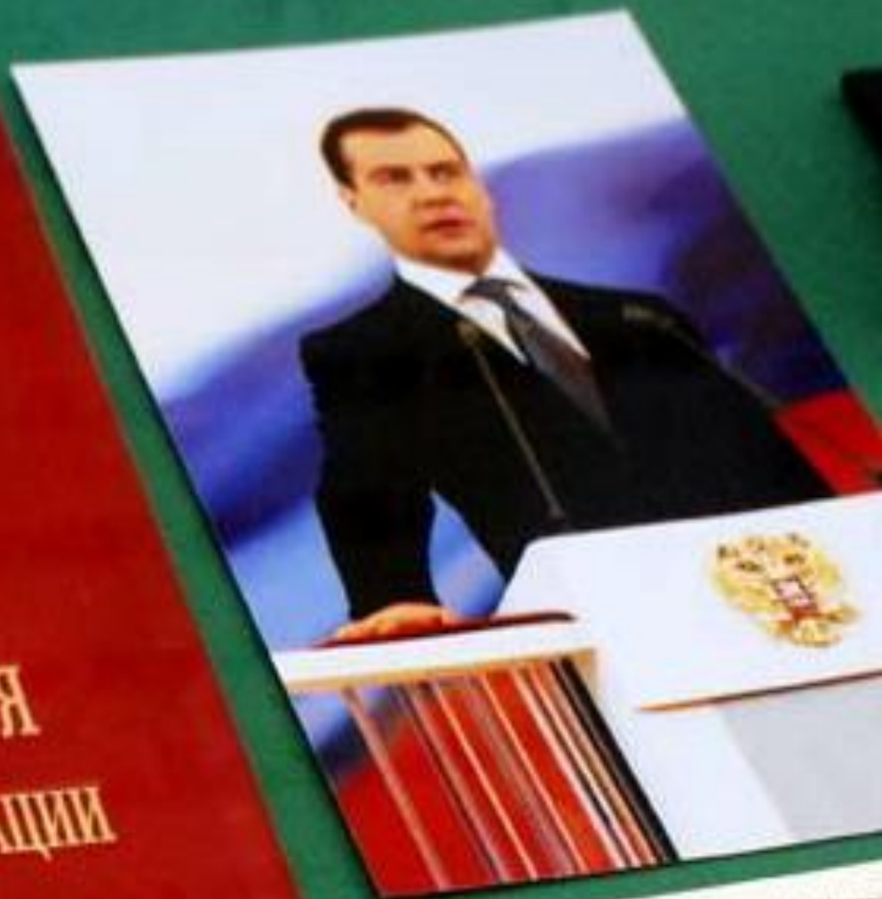
Президент Российской Федерации Д.А. Медведев прислужу на Конституция Российской Федерации Библиотека Администрации Президента России