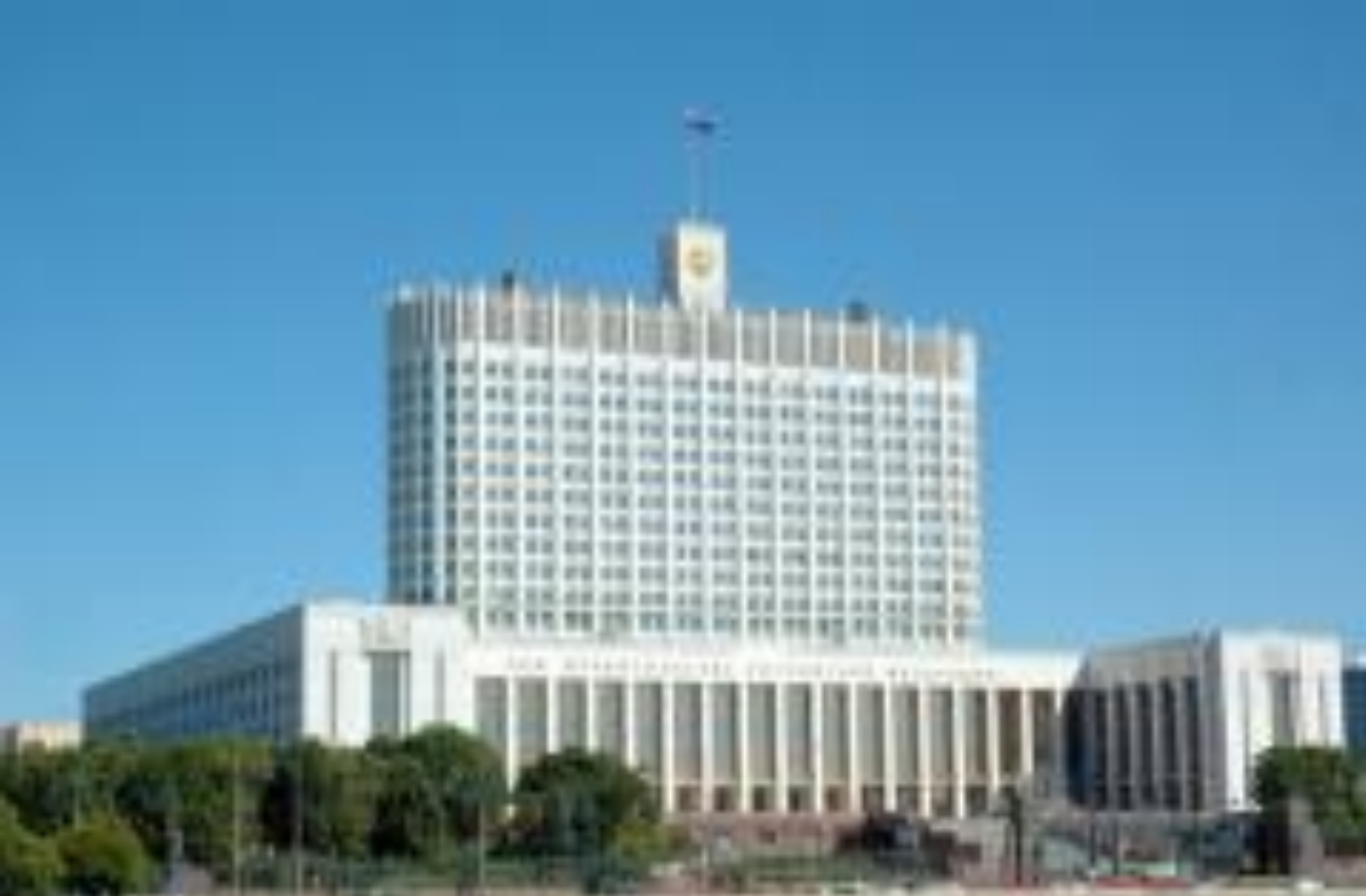
Белый дом (Россия, Москва)