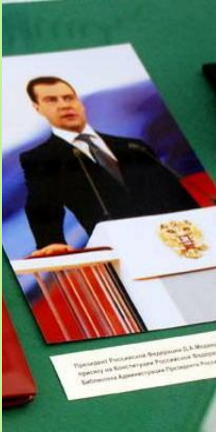
Президент Российской Федерации Д. В. Медведев прислужу на Конституция Российской Федерации Библиотека Администрации Президента России

Может быть отрешен от должности законодательной властью