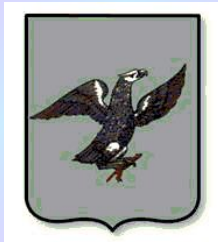
Герб г. Якутска

Город ЯКУТСК , столица Якутии, порт на р. Лена. Связан с железной дорогой (ст. Беркакит) Амуро-Якутской автомагистралью. 196,5 тыс. жителей (1999). Промышленность: легкая, пищевая, стройматериалов, судостроительная и др. ГРЭС. Филиал Сибирского отделения РАН. Якутский университет. 3 театра, 6 музеев, в т. ч. историко-краеведческий, литературный, западноевропейского искусства, изобразительных искусств, алмазов. Основан в 1632, с 1643 на современном месте, центр русской колонизации на Дальнем Востоке.