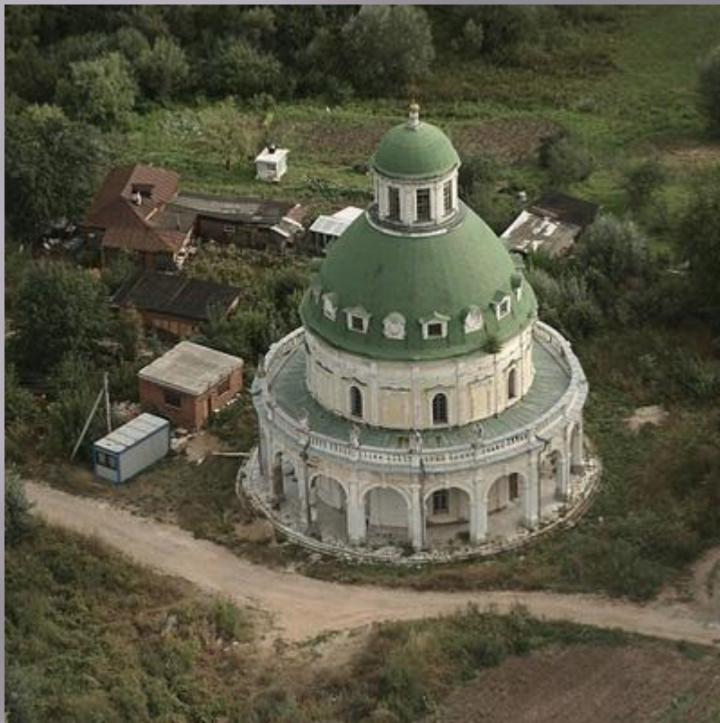
Храм в форме круга