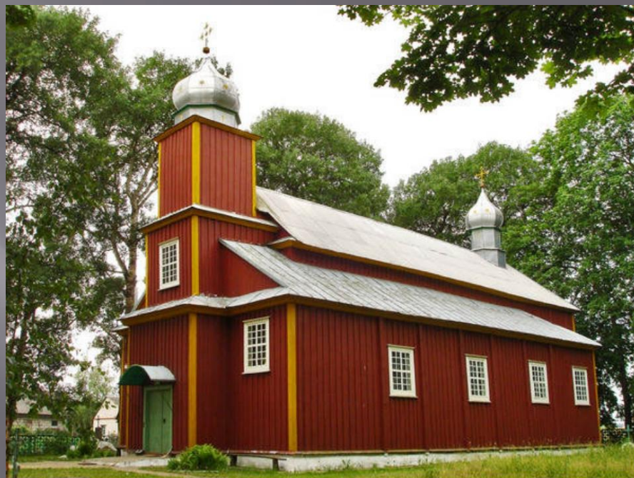
Храм в форме корабля