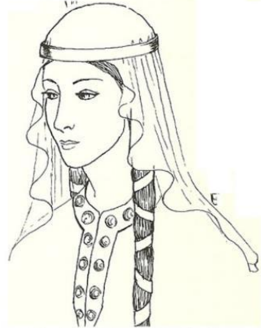
Simpler veil than the head-rail. Rectangle, oval or semi-circle held down with a coronet or even a simple ribbon.