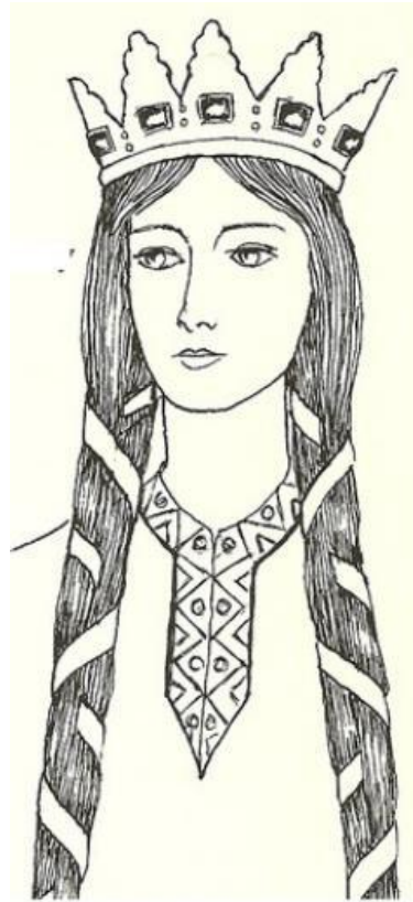
Braid wrapped in ribbons

. Также они могли носить и так называемые «рыцарские» косы - широкие (с ладонь) и очень длинные. Их значительная ширина достигалась за счет многопрядного плетения и полосок ткани, которые вплетались в такие косы