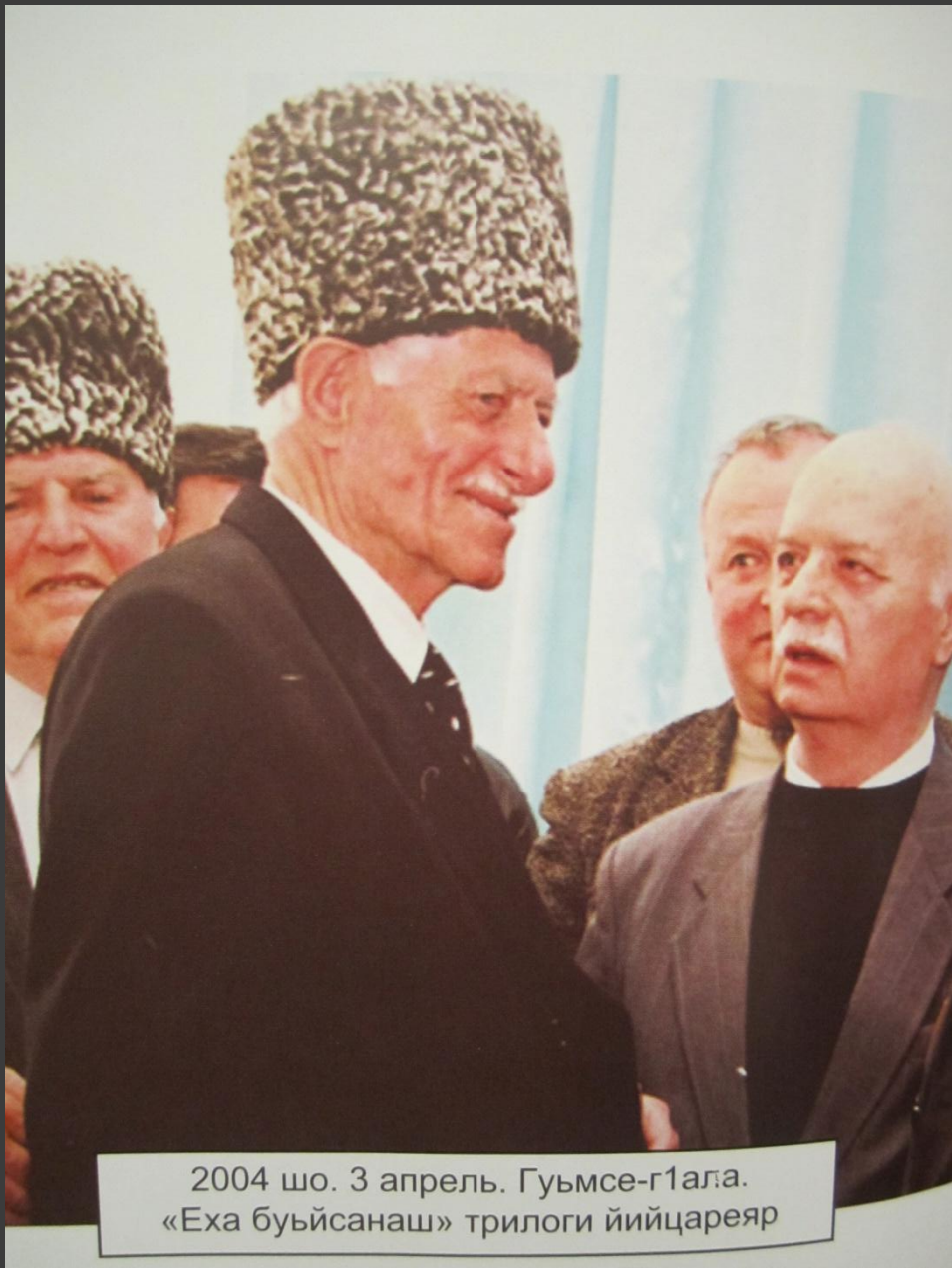
2004 шо. 3 апрель. Гуймсе-г1ала. «Еха буйсанаш» трилоги ийцарейяр