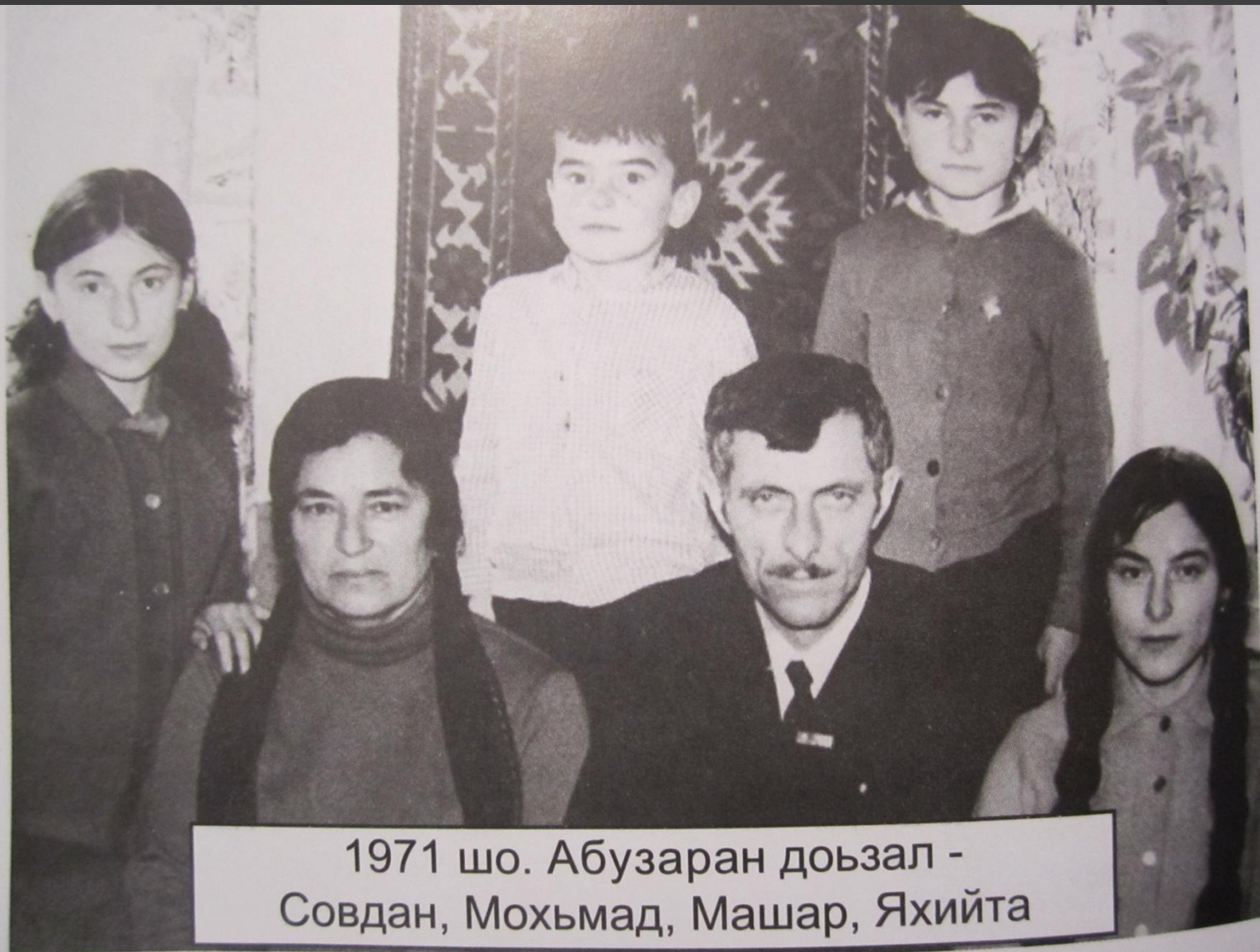
1971 шо. Абузаран доъзал - Совдан, Мохъмад, Машар, Яхийта