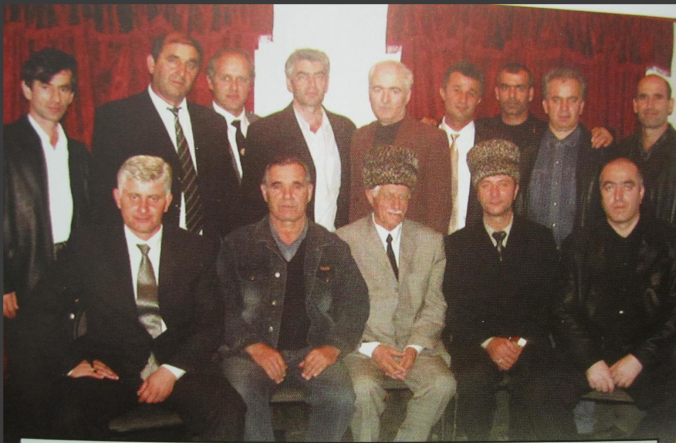
2003 шо. 23 октябрь. Гуьмсе-г1ала. «Вайн амалш» ц1е йолу керла киншка йийцарейр