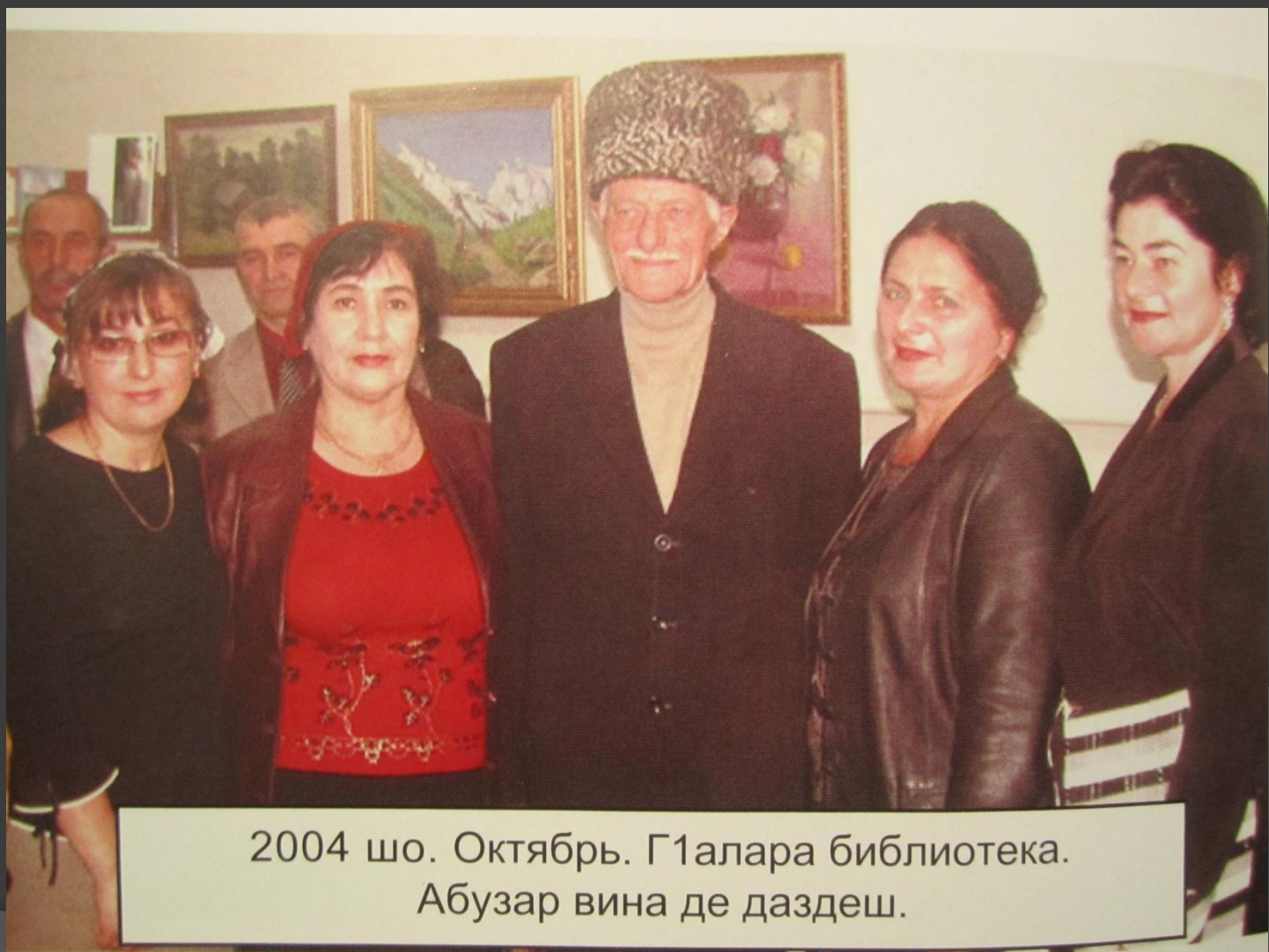
2004 шо. Октябрь. Г1алара библиотека. Абузар вина де даздеш.