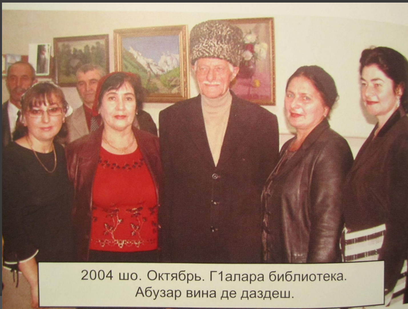
2004 шо. Октябрь. Г1алара библиотека. Абузар вина де даздеш.