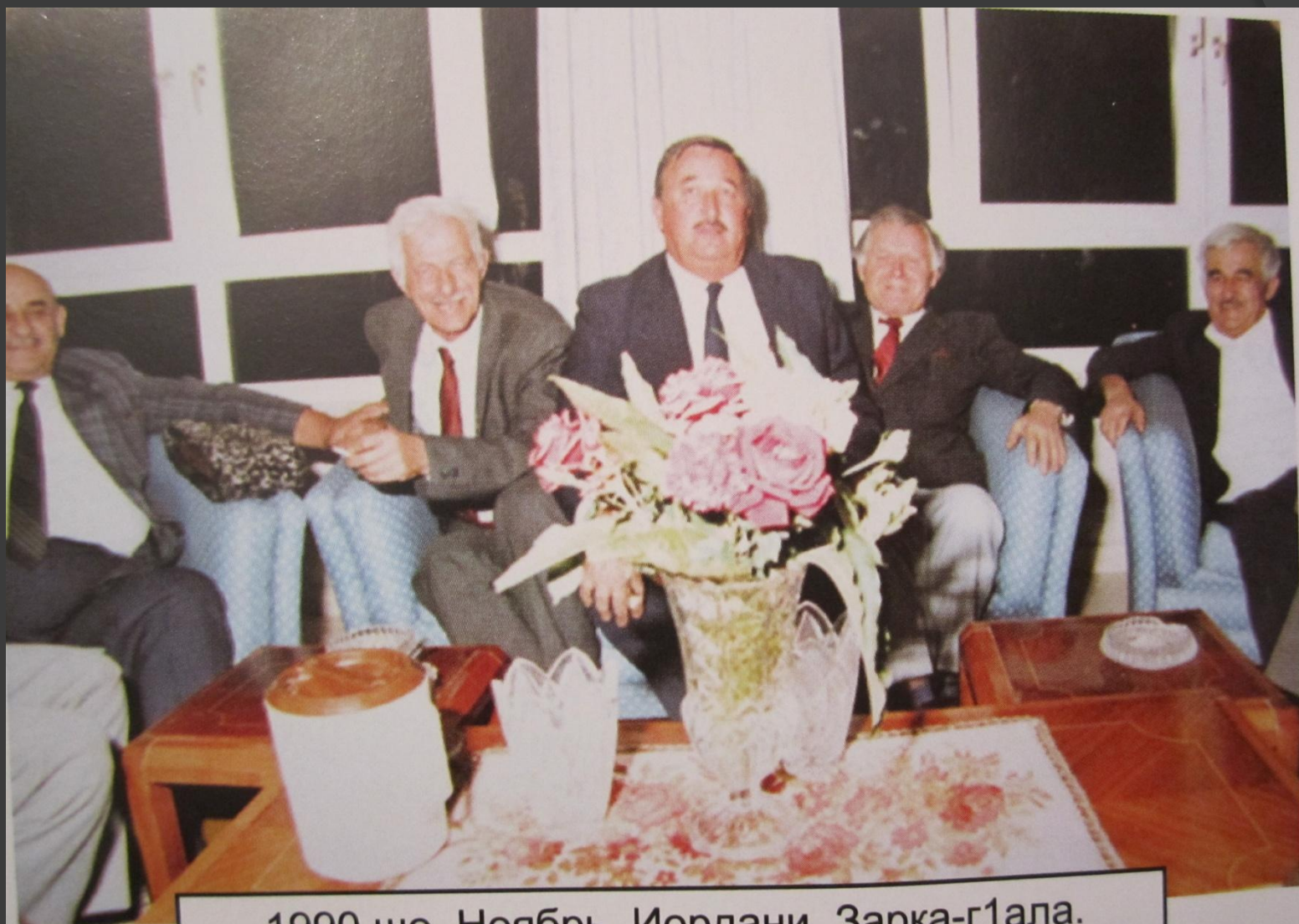
1990 шо. Ноябрь. Иордани, Зарка-г1ала.