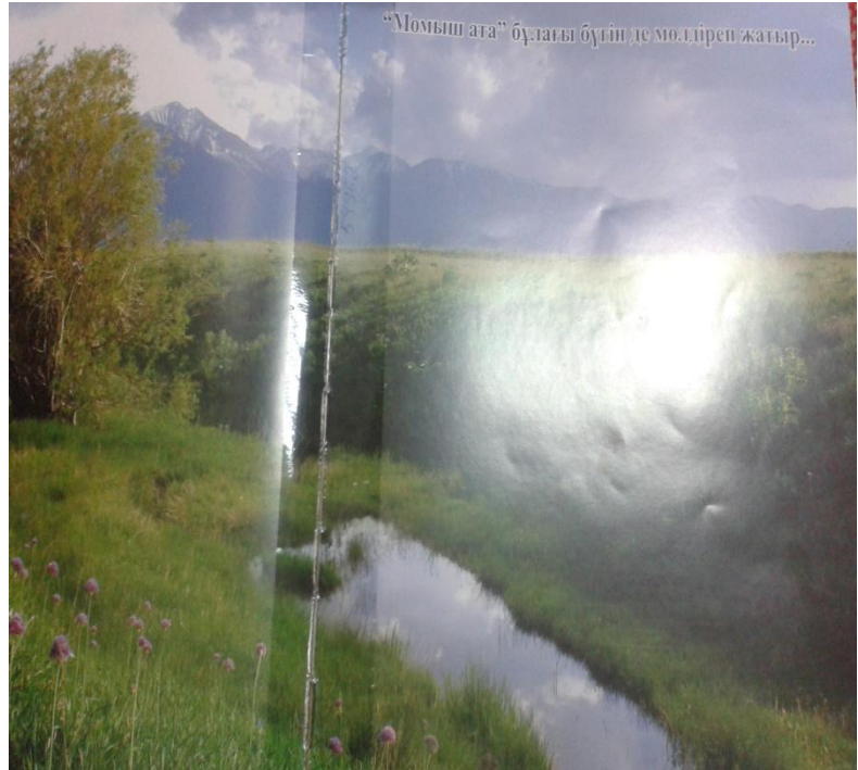
"Момыш ата" бұлағы бүгін де мөлтіреп жағыр...