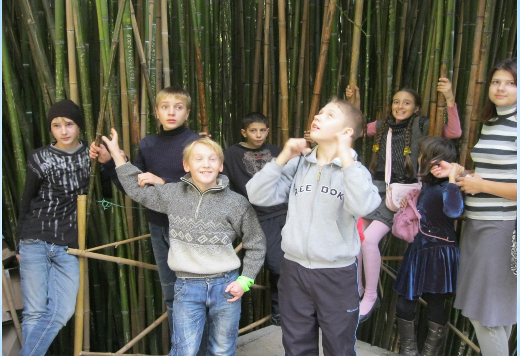
* Бамбуковая роща