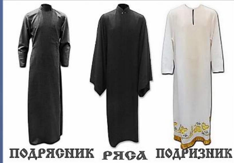
ПОДРЯСНИК РЯСА ПОДРИЗНИК

необходимых молитв. Особим образом от мира показывает мантия или палий – длинная, без рукавов, накидка черного цвета с застежкой на вороте, спускающаяся до земли и покрывающая собой подрясник и рясу.