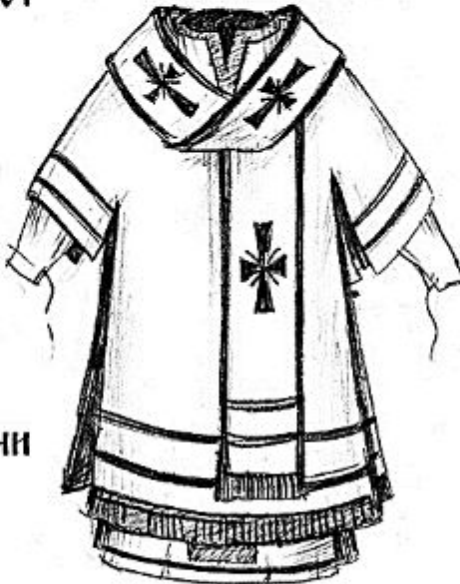
Баккос с большим омофором