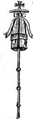
Жеза или Посох