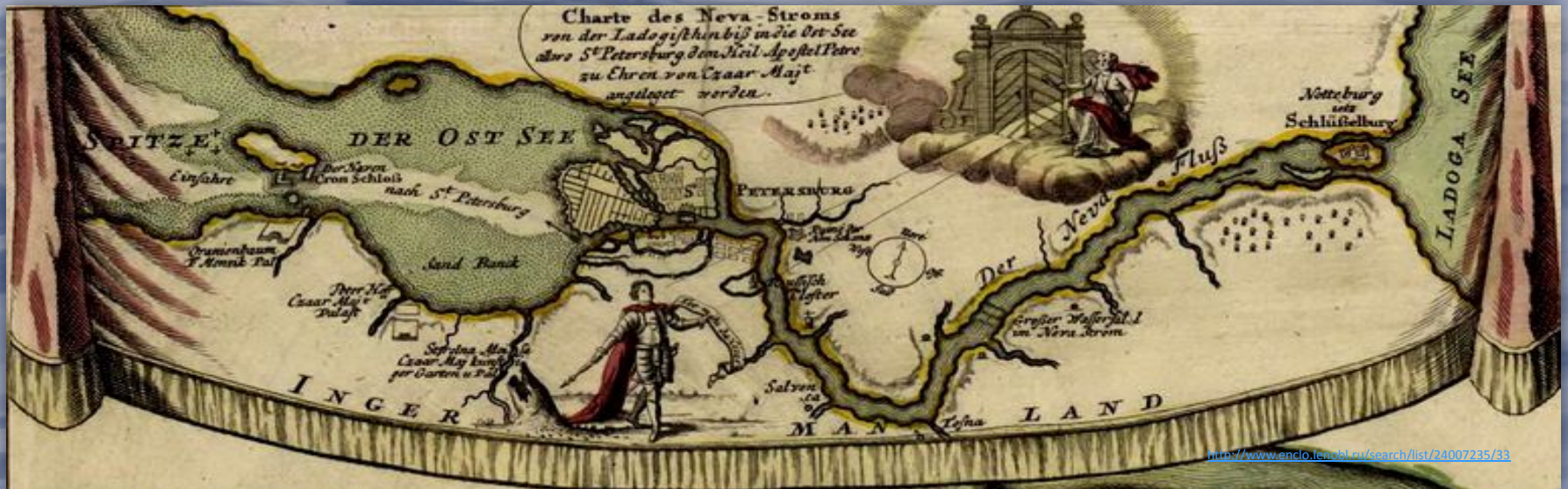
Карта реки Невы. Фрагмент плана Санкт-Петербурга. Издание И.Хоманна

Единого мнения откуда пришло название Нева у ученых нет. Одни считают, что раньше Ладожское озеро называли "Нево", отсюда и название реки, берущей из него начало. Есть версия, что слово "нева" произошло от шведского "ну" или "ню"- новая, или от слова "нёва"-болото, трясина. Река возникла, когда воды Ладожского озера вышли из берегов и хлынули в сторону Балтийского моря. Нева - молодая река среди других рек. Ей всего 2500 лет.