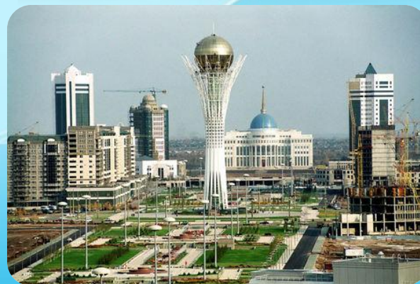
Астана (1998 жылы 10 маусым)