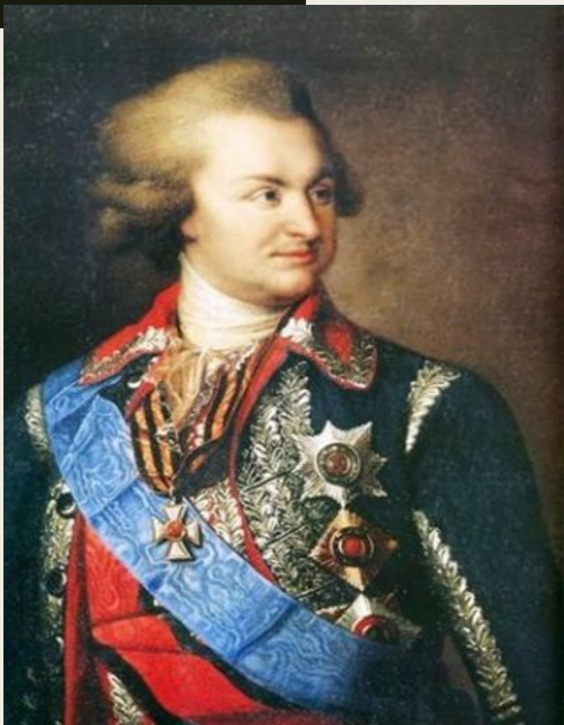
Светлейший князь Григорий Александрович Потёмкин-Таврический