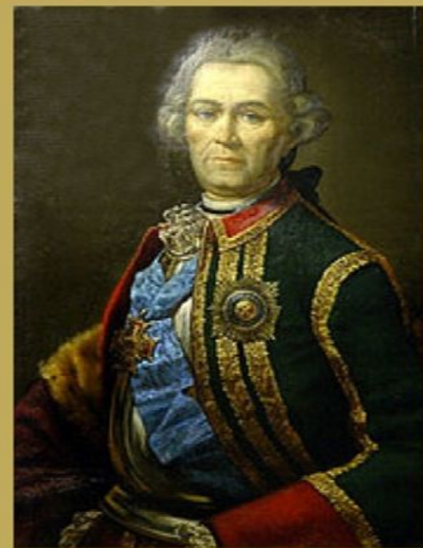
Генерал-фельдмаршал Христофор Антонович Миних