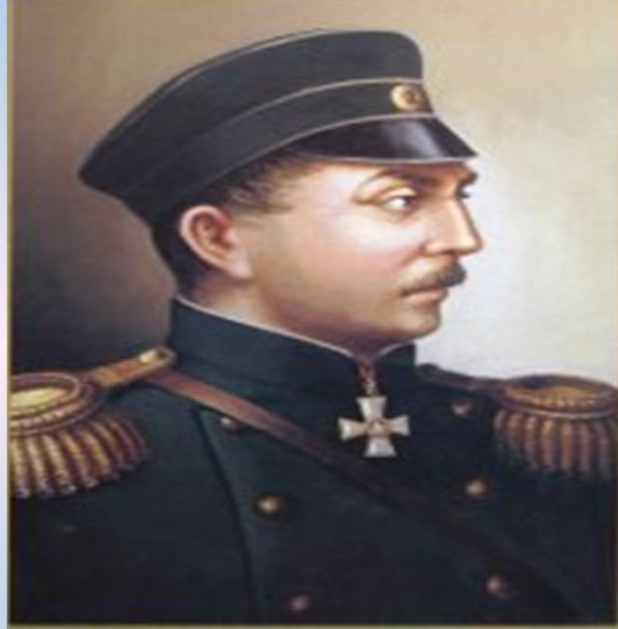
Павел Степанович Нахимов