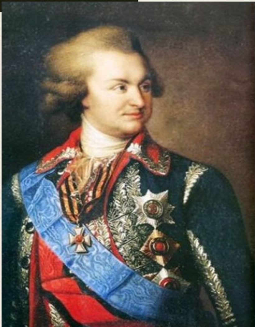
Светлейший князь Григорий Александрович Потёмкин-Таврический