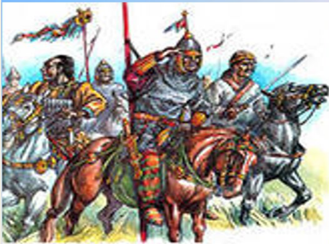
М. Горький. "Полок гуннов"