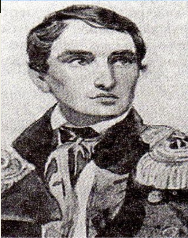
Владимир Алексеевич Корнилов