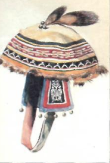
Шапку из камусов с ушниками и султаном из кожа белки носили охотники