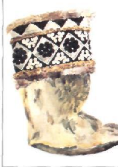
Мужская башмаковидная обувь с отдельно выкроенно подошвой