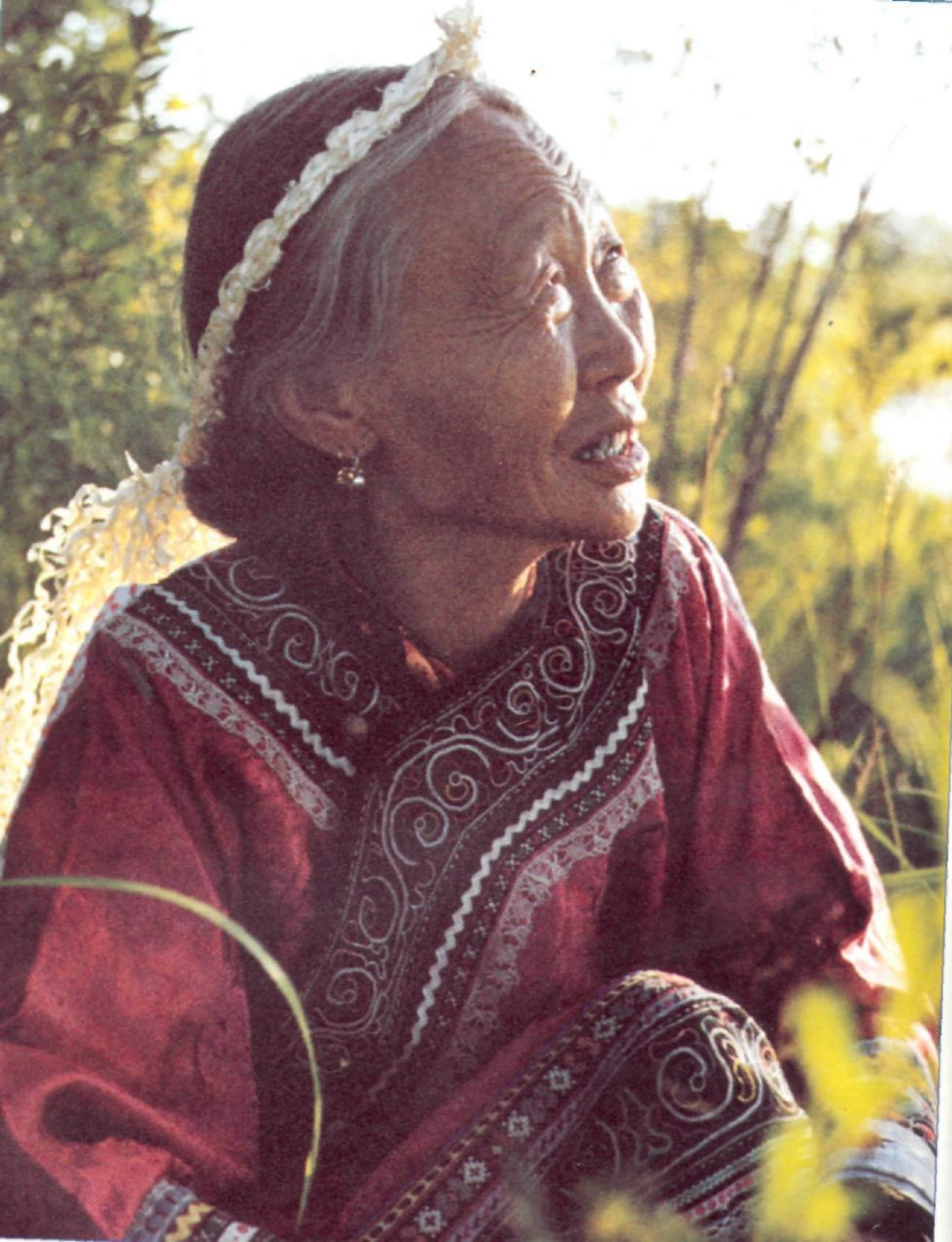
в охотничьем национальном головном уборе