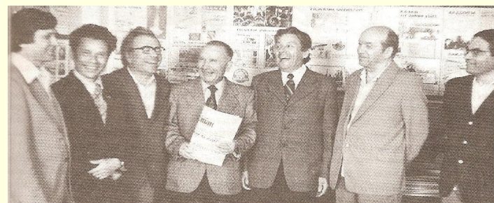
Каләмдәшләр арасында. 1978 ел