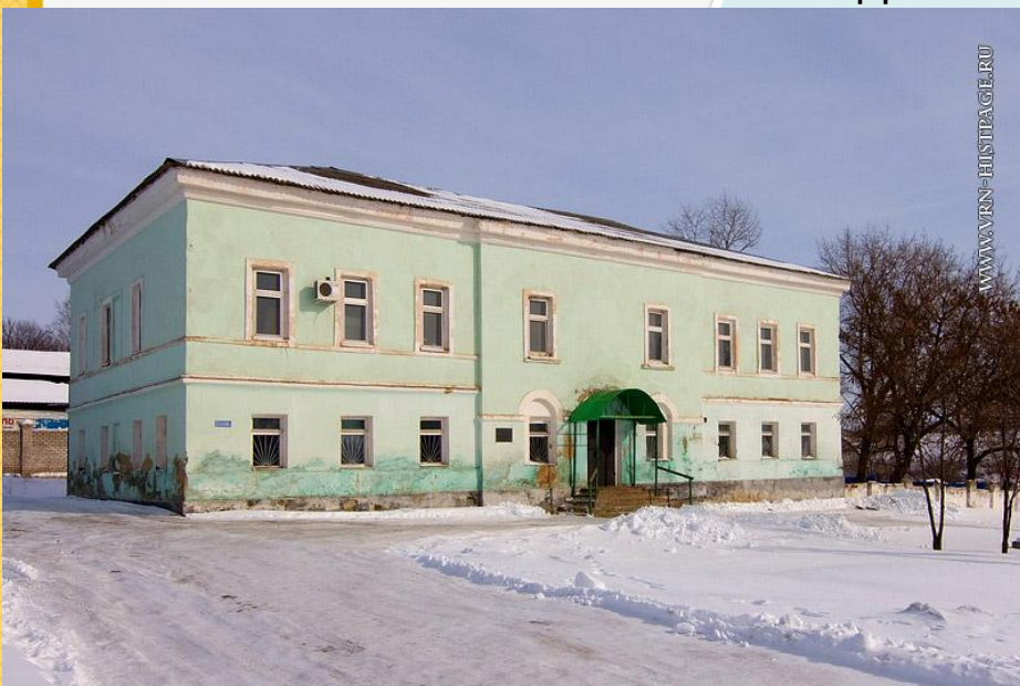
услугами приятней и удобней