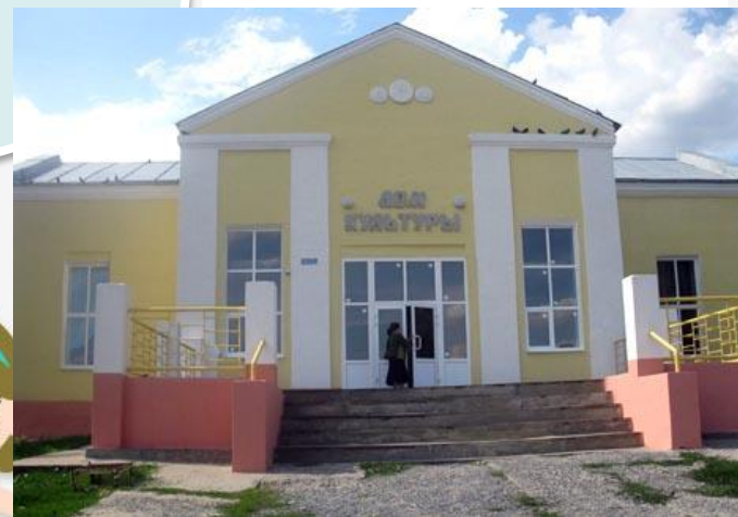
В центр занятости