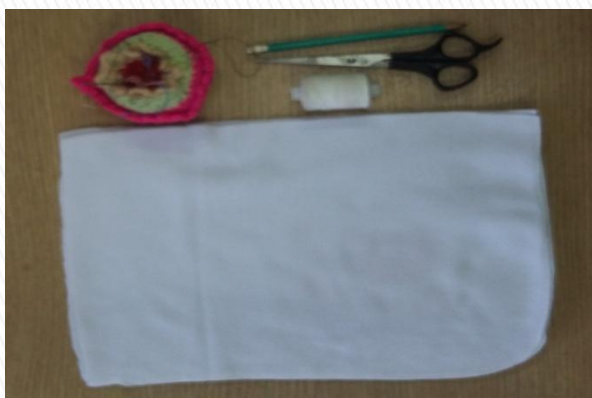
Плотная ткань, ножницы, швейная игла и нитки Старые печатные издания