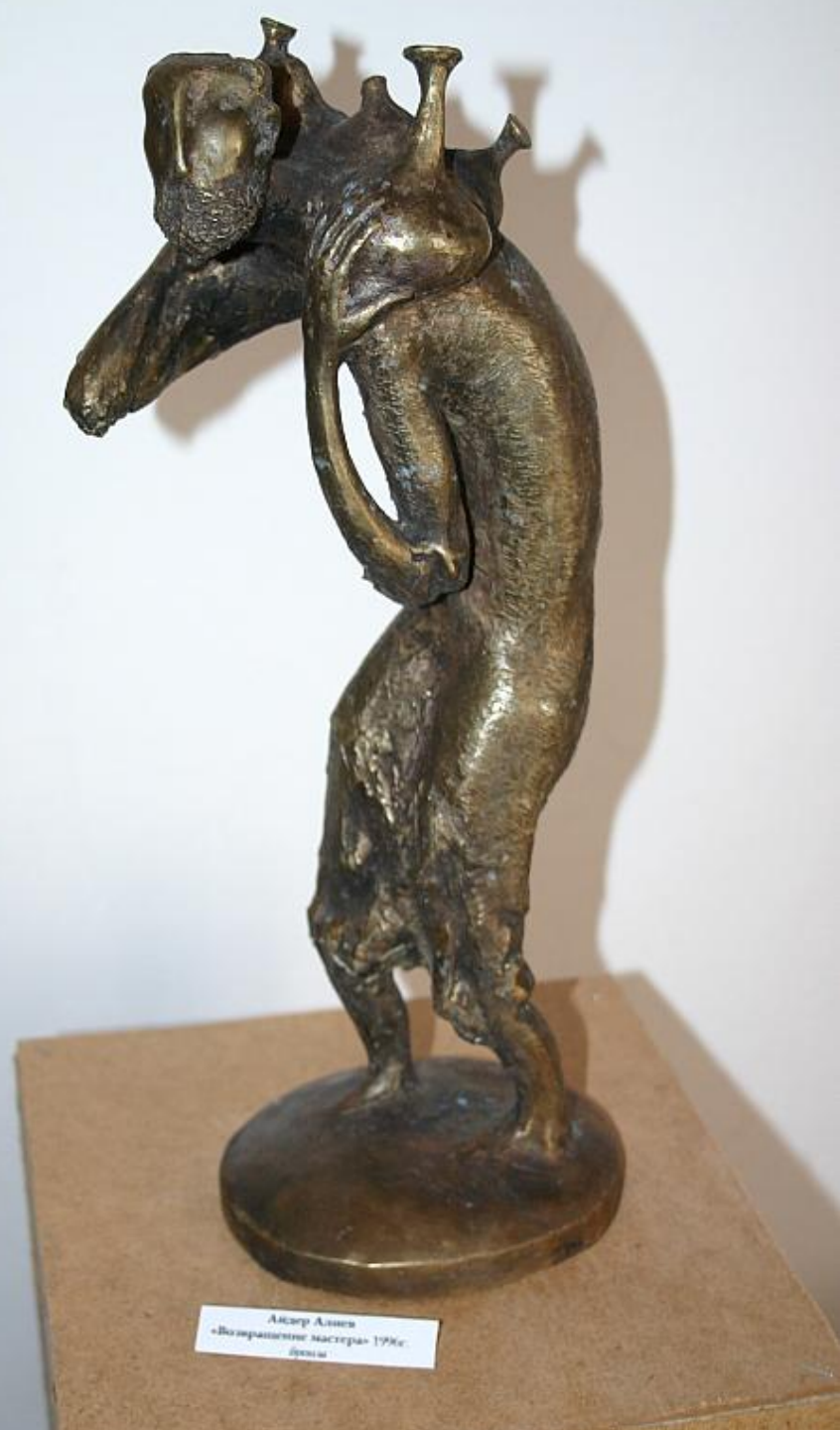
Александр Амосов «Возвращение мастера» 1996г. бронза